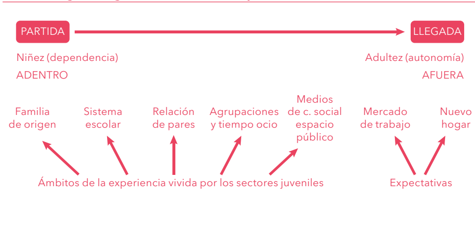
Figura 2. Agents condicionants dels processos de transició simultània

Els autors De Prada, Actis i Pereda (2005) sintetitzen en la figura següent tots els elements susceptibles d'influir en aquestes transicions simultànies. Tenint en compte la variable temps en l'anàlisi, la proposta d'aquests