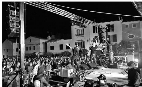
Festival Menorca Jove as Mercadal.