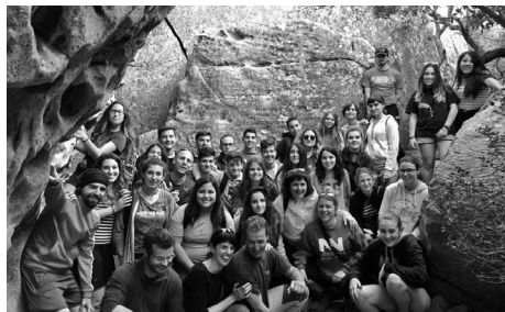
Weekend Aventura (escalada a sa Peña de s'Índio).