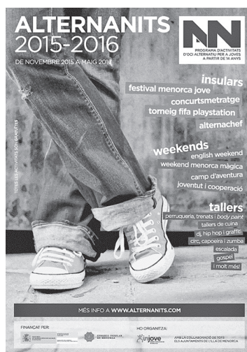
Cartell d'AlternaNits 2015-2016.