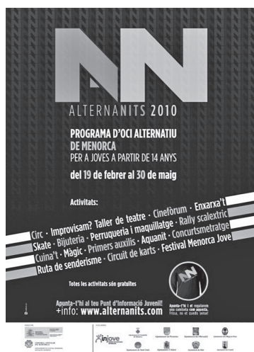
Cartell de la primera edició d'AlternaNits.

En qualsevol cas, totes les activitats del programa estan obertes a la participació de qualsevol jove que hi estigui interessat. L'únic tràmit que ha de fer és, en alguns casos, inscriure's als casals juvenils, centres cívics o punts d'informació juvenil municipals.