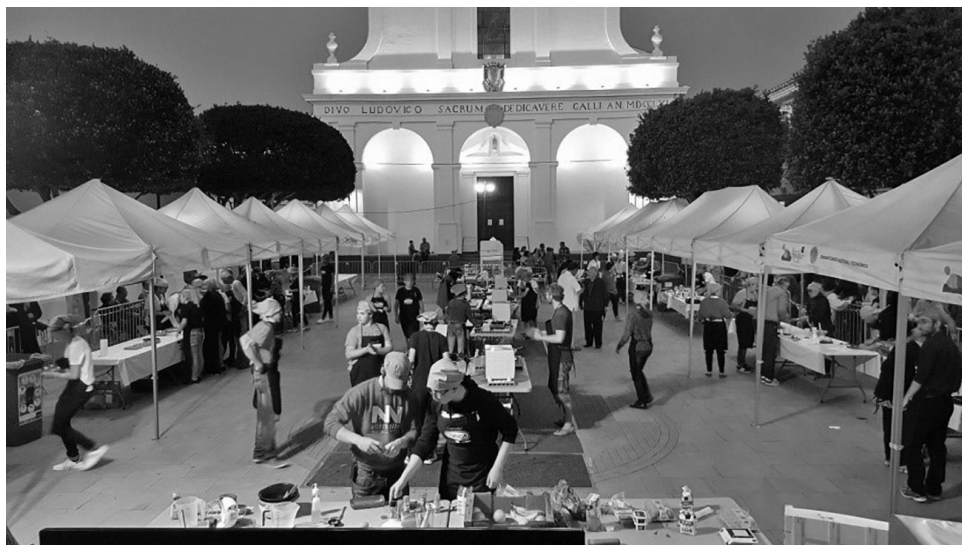
Concurs de cuina AlternaChef a Sant Lluís.

Aquest període suposa l'inici d'un nou tipus d'activitat, els weekends o colònies monotemàtiques, que s'incorpora al programa AlternaNits per dur a terme un treball de sensibilització en un entorn diferent dels casals de joves, i s'arriba a un sector de població que no és usuària d'aquests equipaments.