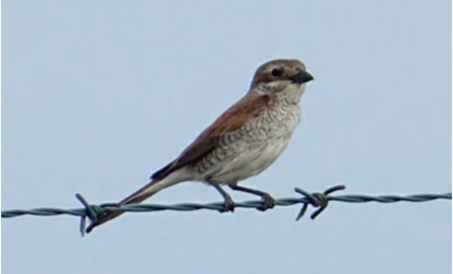
Foto 5. Capsigrany roig Lanius collurio (Red-backed Shrike), femella, a prop de Maó, 25 de maig de 2020. Autor: Galatea Lligoña.

(Holàrtic). Tercera cita per a Portocolom. Pas prenupcial, del 29 de març al 28 de maig. Pas postnupcial tan sols una cita el 3 d'octubre. No hi ha altres dades bibliogràfiques de les nostres illes, el fet que no se n'observin segurament és a causa d'una menor atenció envers les aus marines pelàgiques.