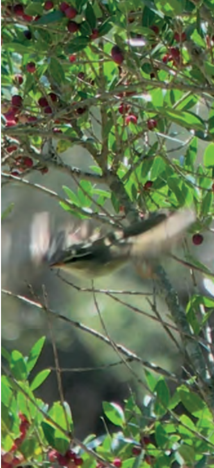
Foto 9. Ull de bou boreal Phylloscopus borealis (Arctic Warbler), Ariant, Pollença, 12 de setembre de 2020.