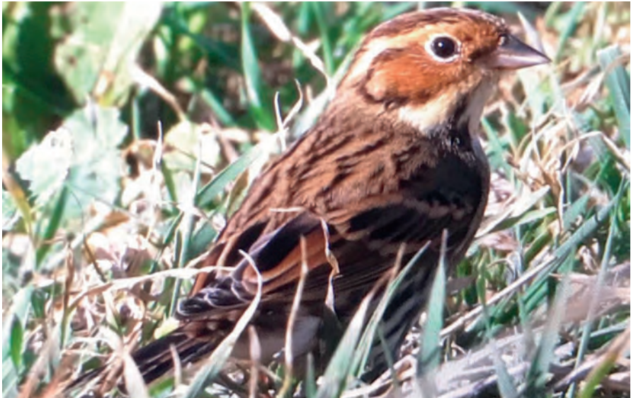
Foto 13. Hortolà petit Emberiza pusilla (Little Bunting), Parc Nacional de Cabrera, 9 d'octubre de 2020. Autor: Jason Moss.