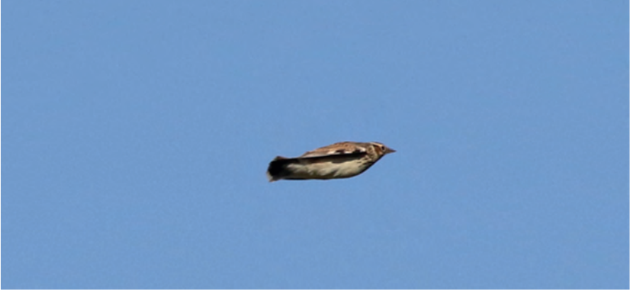
Foto 7. Cototiu Lullula arborea (Woodlark), Parc Nacional de Cabrera, 8 d'octubre de 2020.