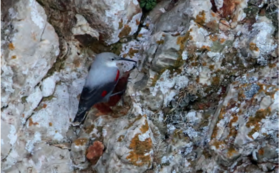
Foto 10. Pela-roques Tichodroma muraria (Wallcreeper), Parc Natural de sa Dragonera, 31 d'octubre de 2020. Autor: Maties Rebassa.