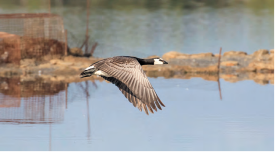
Foto 1. Oca galtablanca Branta leucopsis (Barnacle Goose), Parc Natural es Trenc-Salobrar, 19 de juliol de 2020.