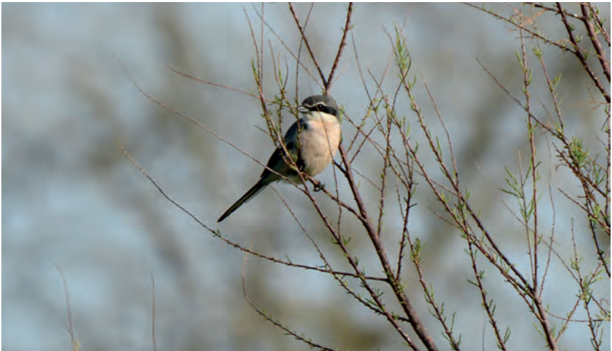
Foto 6. Capsigrany reial Lanius meridionalis (Iberian Grey Shrike), Parc Natural es Trenc-Salobrar, 29 de febrer de 2020.

(Paleàrtic). Tercer registre homologat per a Cabrera. Tots els registres són del pas postnupcial (4/X, 1/XI), primer del 8 d'octubre i darrer el 11 de novembre.