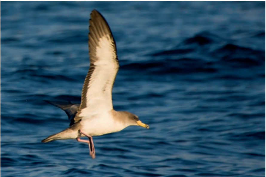
Foto 2. Virot gros atlàntic Calonectris borealis (Cory's Shearwater), Parc Nacional de Cabrera, 13 d'octubre de 2013.