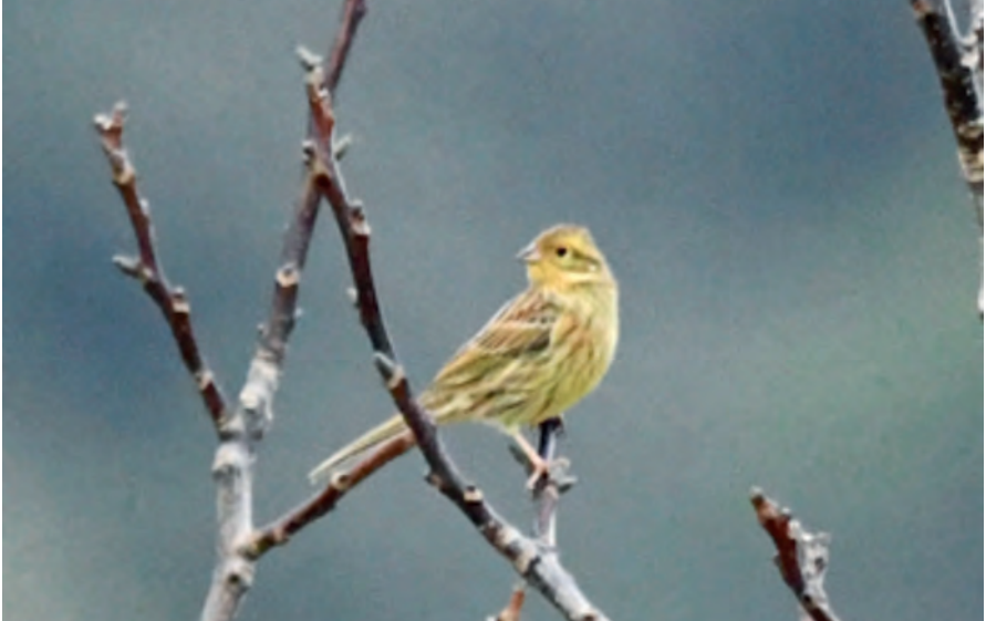
Foto12. Hortolà groc Emberiza citrinella (Yellowhammer), vall d'Orient, Bunyola, 1 de gener de 2020. Autor: Miquel Vallespir.

Finca Galatzó, Calvià, fins a quatre exemplars, el 6 de novembre de 2020, hi ha foto (Gabriel Bernat, Josep Manchado). Segueixen presents quatre exemplars el 7 de novembre (Josep Manchado).