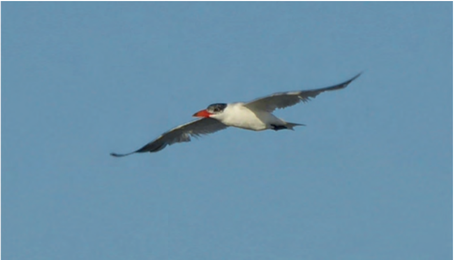
Foto 4. Llabritja bec vermell Hydroprogne caspia (Caspian Tern), estany des Peix, Parc Natural de ses Salines d'Eivissa i Formentera, 13 d'octubre de 2020.