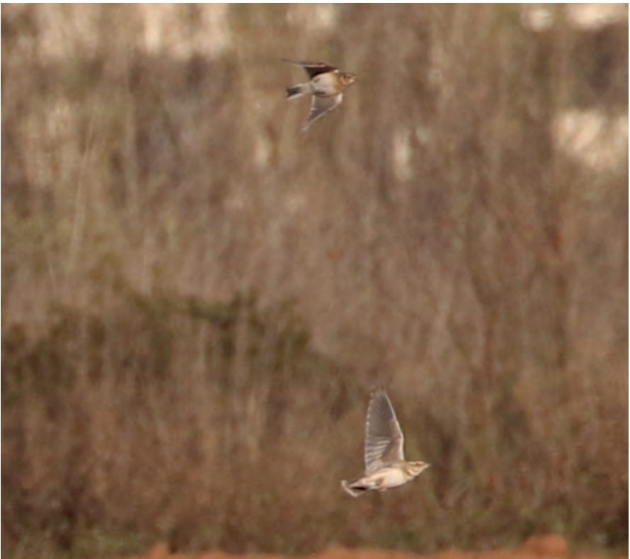
Foto 8. Calàndria bimaculada (baix) Melanocorypha bimaculata (Bimaculated Lark), Parc Natural es Trenc-Salobrar, 31 de desembre de 2020.