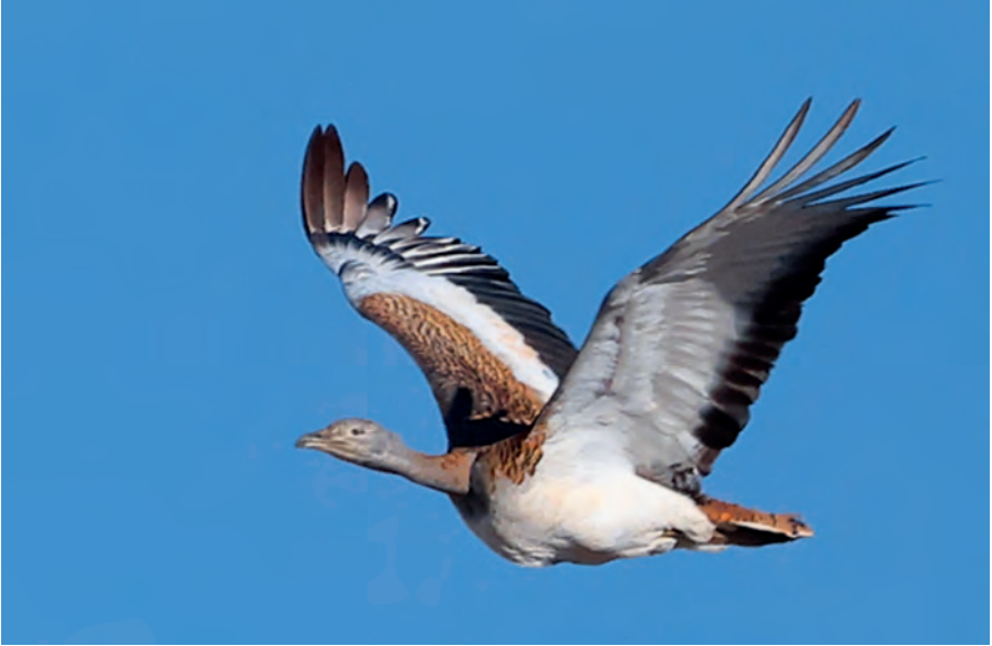
Foto 3. Pioc Otis tarda (Great Bustard), mascle de primer any, es Caló, Formentera, del 22 fins al 26 de setembre de 2020. Autor: Roger Cases.