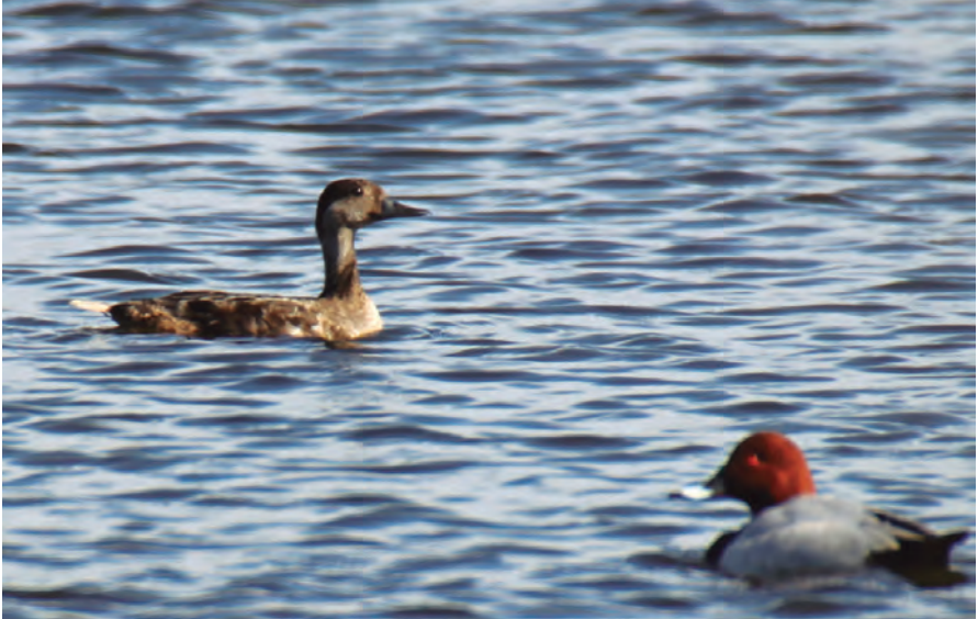
Foto 2. Negreta Melanitta nigra (Common Scoter), femella, Maristany (Alcúdia), 28 de febrer de 2017.