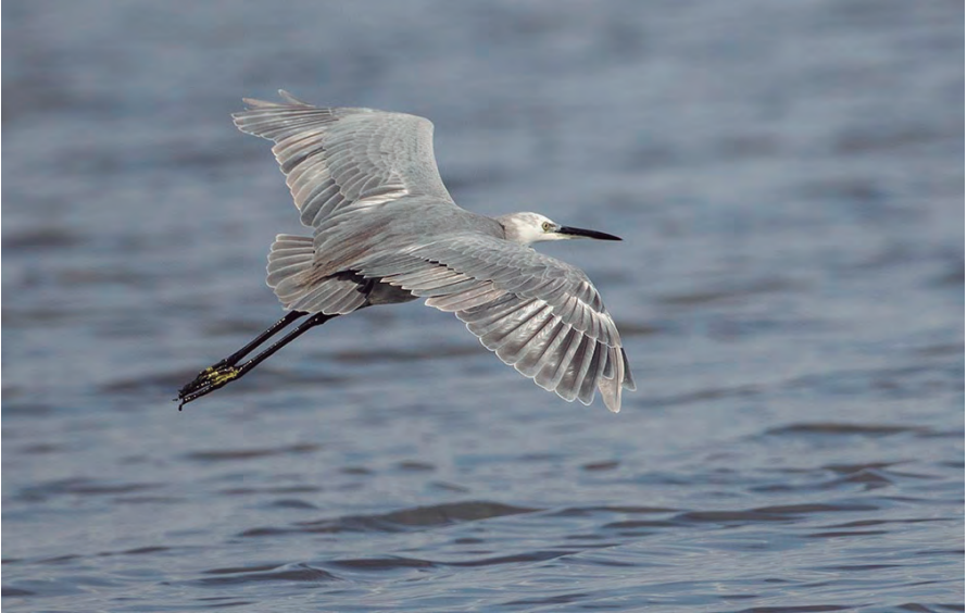
Foto 3. Híbrid agró d'escull x agró blanc Egretta gularis x Egretta garzetta (Western Reef Heron x Little Egret), Salobrar de Campos, 26 de setembre de 2017.