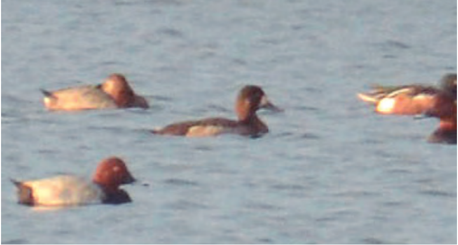
Foto 1. Moretó cabussó Aythya marila (Scaup), femella, Bassa de Can Guidet (Palma), 1 de novembre de 2017.

Mallorca : Maristany (Alcúdia), dos exemplars, hi ha foto, de l'1 al 21 de juliol de 2017 (Juanjo Bazán, Mika Palmer, Pedro Van der Knoop, Josep Manchado, Nacho Barcia; Phil Andrews, Mike Montier; Maties Rebassa).