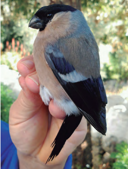
Foto 21. Pinsà borroner Pyrrhula pyrrhula (Bullfinch), femella, barranc de Son Fideu (Ferreries), 18 de novembre de 2017. Autor: Raül Escandell.

Cabrera : una femella, fotografiada el 3 de maig de 2016 (Daniel López-Velasco / Birdquest).