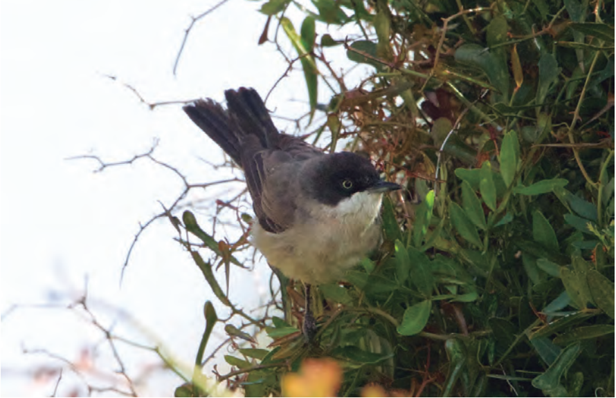
Foto 17. Busqueret emmascarat Sylvia hortensis (Orphean Warbler), mascle, vall de Bóquer (Pollença), 28 d'abril de 2017.