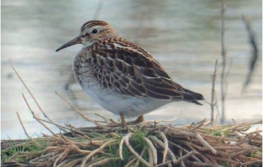
Foto 12. Corriol pectoral Calidris melanotos (Pectoral Sandpiper), prat de Sant Jordi (Palma), 4 d'octubre de 2017.

(Neàrtic i Paleàrtic occidental). Quarta cita per al port de Palma. Previs al comitè de rareses hi ha dues citacions a Formentera, sempre d'un exemplar de l'1 de novembre de 1987 i 28 de juliol de 1990 (Wijk, 1988 i 1991). Dates extremes de la cites homologades: prenupcial dos registres, el 6 d'abril i l'1 de març; postnupcial hi ha tres cites, del 14 d'agost fins al 7 d'octubre.