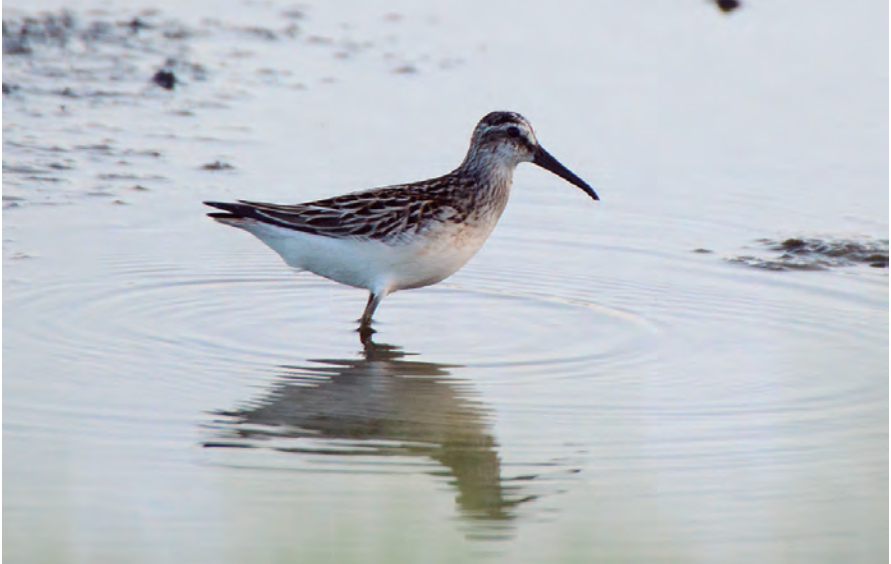
Foto 11. Corriol becadell Calidris falcinellus (Broad-billed Sandpiper), juvenil, Salobrar de Campos, 16 d'agost de 2016.

4 d'abril; i en el pas postnupcial amb 35 registres (10/VIII, 22/IX, 6/X), del 16 d'agost fins al 30 d'octubre. El CRB considera provada la presència regular de l'espècie i deoixa de ser considerada raresa a Balears a partir de l'1 de gener de 2017.