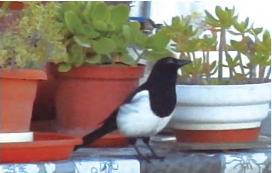
Foto 24. Garsa Pica pica (Magpie), Cala d'Or (Santanyí), 26 de setembre de 2017.