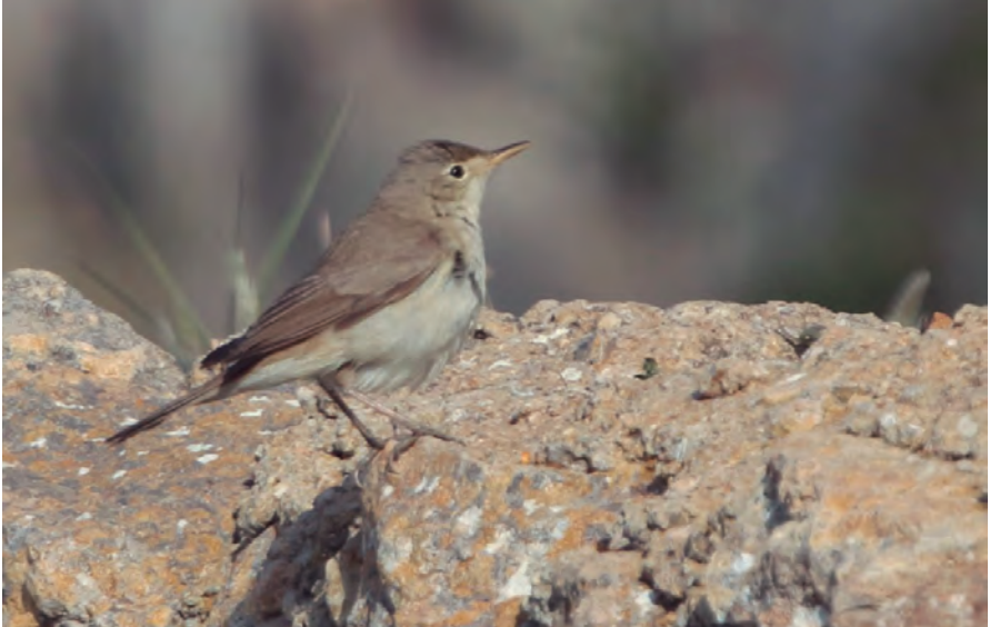
Foto 15. Bosqueta pàl·lida Iduna opaca (Olivaceous Warbler), Parc Nacional de Cabrera, 6 de maig de 2017, Autor: Juan Sagardía.

Iduna opaca (abans Hippolais opaca ) Bosqueta pàl·lida.