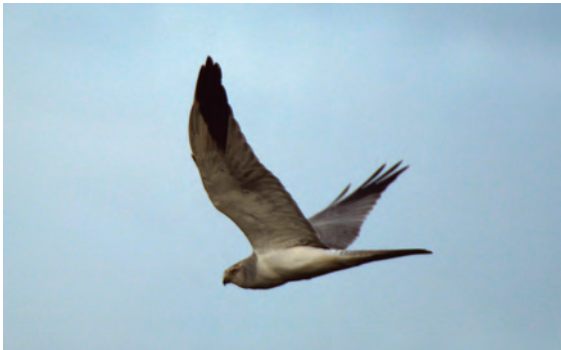
Foto 7. Arpella pàl·lida russa Circus macrourus (Pallid Harrier), mascle, Parc Natural de s'Albufera de Mallorca, 1 d'abril de 2017.