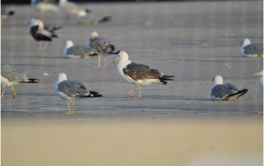
Foto 13. Gavinet Larus marinus (Great Black-backed Gull), exemplar de tercer any (al centre), port de Palma, 14 d'agost de 2017.