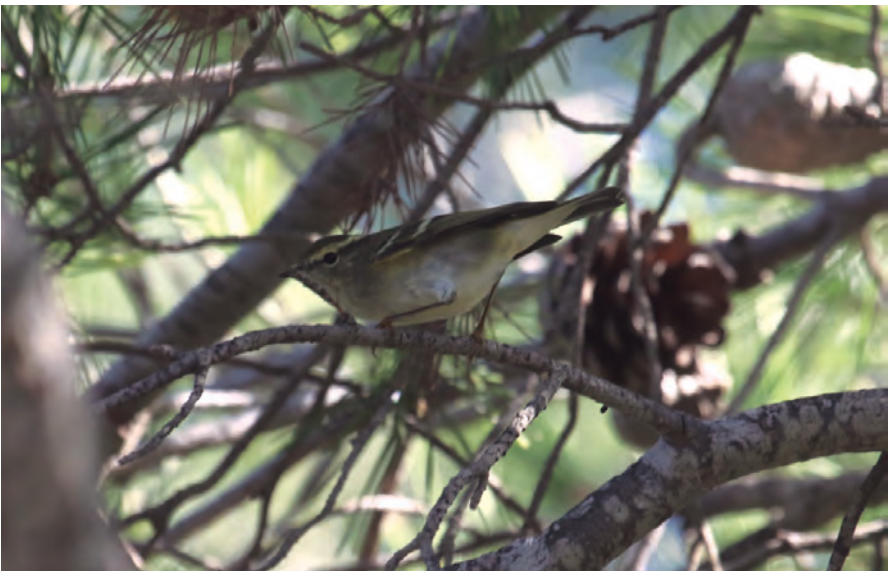
Foto 18. Ull de bou de dues retxes, Phylloscopus inornatus (Yellow-browed Warbler), Portocolom (Felanitx), 25 d'octubre de 2017. Autor: Jason Moss.