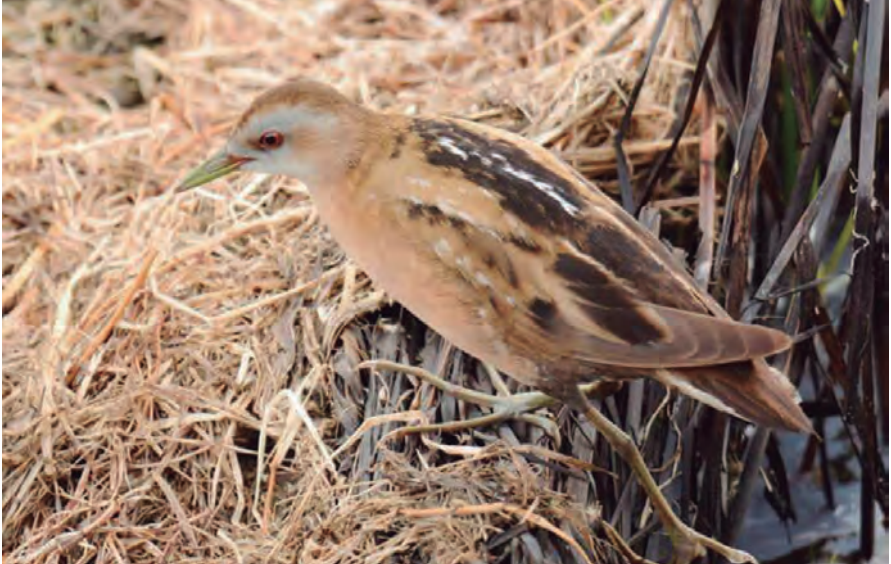
Foto 9. Rasclotó Porzana parva (Little Crane), femella, Parc Natural de l'Albufera des Grau (Maó), el 17 de maig de 2017