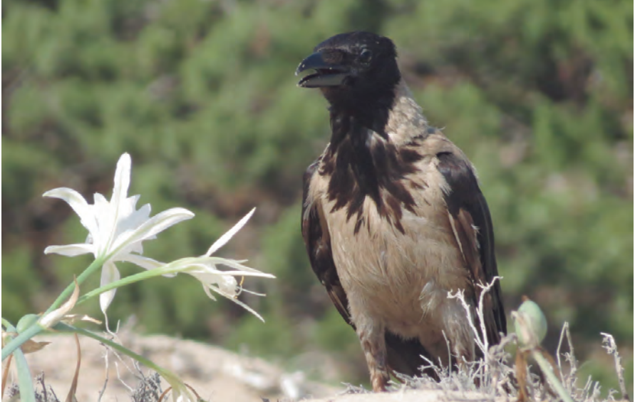
Foto 20. Cornella emmantellada Corvus cornix (Hooded Crow), Parc Natural de ses Salines (Sant Josep de sa Talaia, Eivissa), 7 de setembre de 2016.

per a anellament (Raül Escandell) (vegeu-ne foto 19).