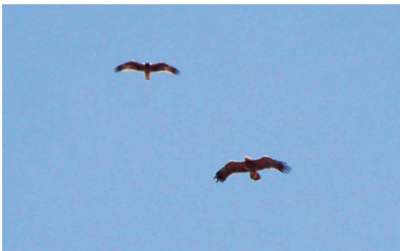
Foto 8. Àguila pomerània Aquila pomarina (Lesser Spotted Eagle) (a baix), esparver Aquila pennata (Booted Eagle) (a dalt), cap de ses Salines (Santanyi), 12 d'octubre de 2016.