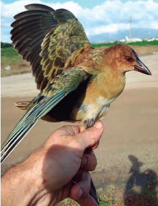
Foto 10. Gallet faver africà Porphyrio alleni (Allen's gallinule), juvenil, aeroport de Palma, 6 de desembre de 2016.

ha fotos, el 17 de maig de 2017 (Bàrbara Salvá) (vegeu-ne foto 9).