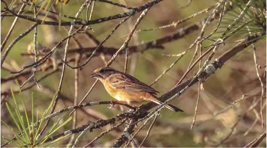
Foto 22. Hortolà negre Emberiza cia (Rock Bunting), zona nord de Ciutadella (Menorca), 15 d'octubre de 2017.

Mallorca : Clot d'Albarca (Escorca), un exemplar, hi ha fotos, el 12 de novembre de 2017 (Carlos López-Jurado, Maties Rebassa, Josep Manchado, Nacho Barcia, Juan Miguel González).