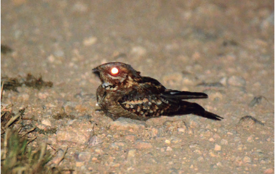
Foto 14. Siboc Caprimulgus ruficollis (Red-necked Nightjar), Parc Nacional de Cabrera, 4 de maig de 2017.

4/5/I, 3/6/II, 3/4/III, 4/8/IV, 0/V, 0/VI, 0/VII, 0/VIII, 0/IX, 6/8/X, 6/9/XI, 5/7/XII.