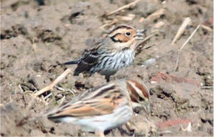
Foto 23. Hortolà petit Emberiza pusilla (Little Bunting), Maó (Menorca), 23 de febrer de 2016.