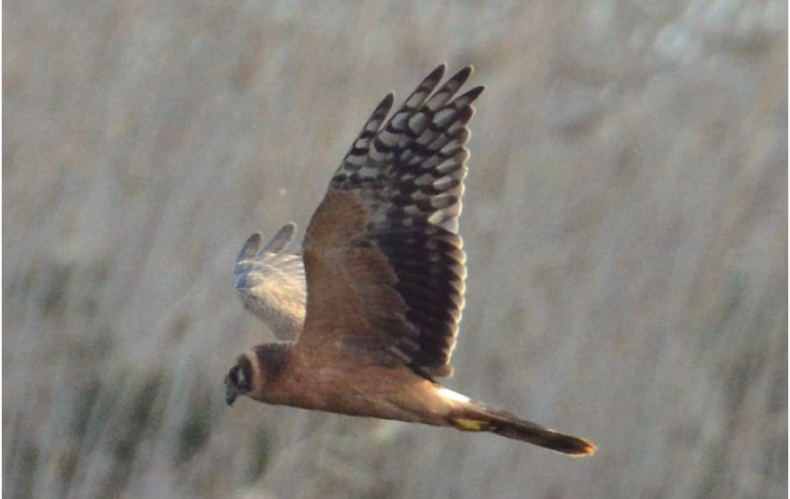
Foto 5. Arpella pàl·lida russa Circus macrourus (Pallid Harrier), juvenil, Parc Natural de s'Albufera de Mallorca, 13 de gener de 2017.