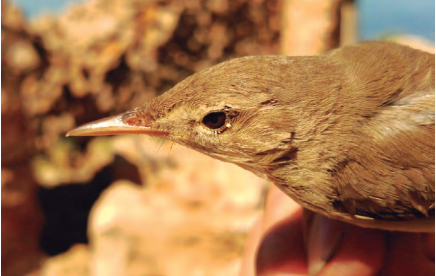
Foto 16. Bosqueta pàl·lida Iduna opaca (Olivaceous Warbler), adult, illa de l'Aire (Sant Lluís), 14 de maig de 2017.