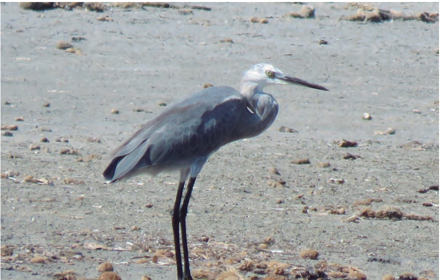
Foto 4. Híbrid agró d'escull x agró blanc Egretta gularis x Egretta garzetta (Western Reef Heron x Little Egret), Albufereta (Pollença), 5 de setembre de 2017.