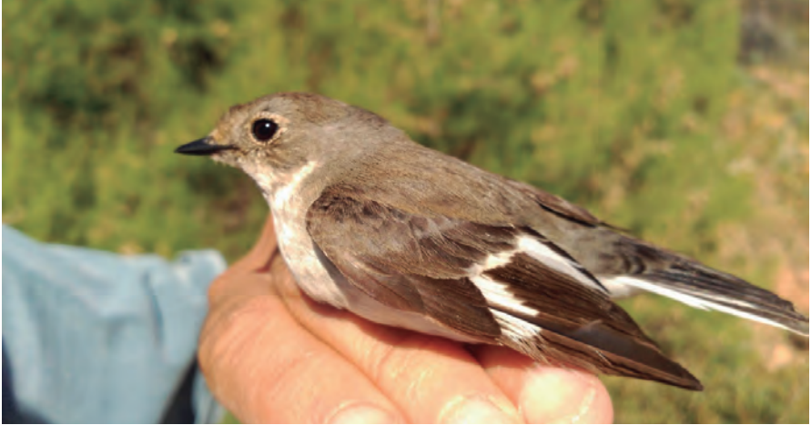
Foto 19. Menjamosques de collar Ficedula albicollis (Collared Flycatcher), femella adulta, illa de l'Aire (Sant Lluís, Menorca), 4 de maig de 2016.

fotografiat el 23 d'octubre de 2017.