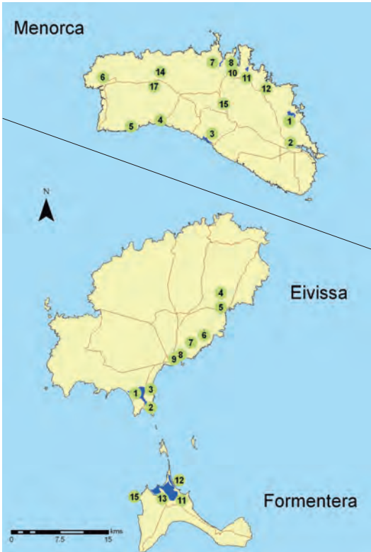
Mapa 2. Situació de les localitats on s'ha fet el recompte a Menorca, Eivissa i Formentera el gener de 2018. El nombre es correspon amb la taula 1. Map 2. Census localities in Menorca, Ibiza and Formentera. January 2018. The numbers on the map match those on table 1.

i agró blanc Egretta gularis x Egretta garzetta vist a els estanys des Codolar.