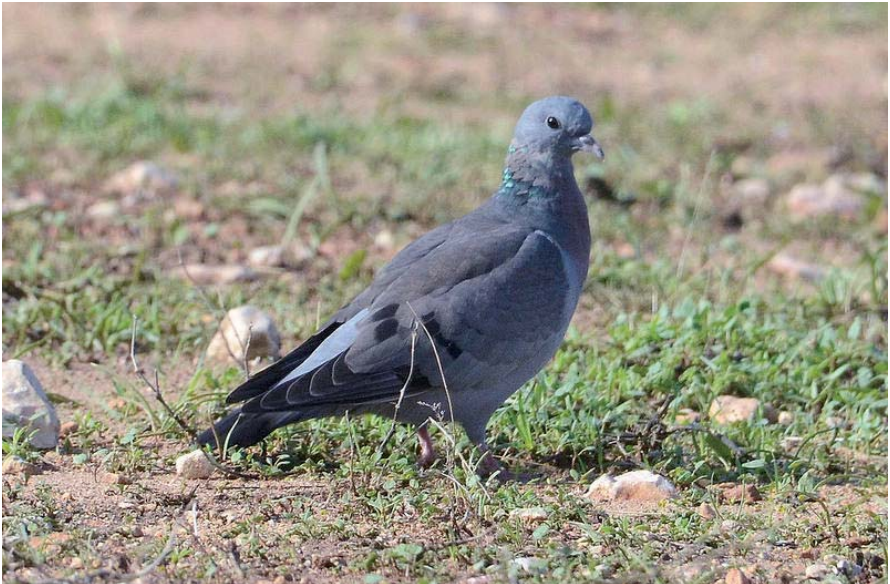
Foto 13. Xixell Columba oenas (Stock Dove), Parc Nacional de Cabrera, 20 d'octubre de 2016.