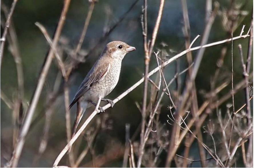
Foto 24. Capsigrany pàl·lid Lanius isabellinus (Isabelline Shrike), Parc Natural de s'Albufera de Mallorca, 30 d'octubre de 2014.

és prest per a definir-ne una tendència clara. Mentre s'espera algun exemplar que presenti totes les característiques necessàries per a assegurar-ne la identificació a nivell de subespecífic com a phoenicuroides , s'ha de comentar que l'exemplar de Mallorca sí mostrava alguns caràcters que apuntaven en aquesta direcció, tal i com corroboren alguns experts consultats. Tenint en compte la proporció de capsigranys pàl·lids que s'assignen a aquesta subespècie al Regne Unit (per exemple, HUDSON et al. , 2016), és probable que ens trobem a prop de la primera observació a Espanya (GIL-VELASCO, et al. 2017). Segon registre homologat a Balears, l'anterior era del 9 de setembre de 1994 al Salobrar de Campos.