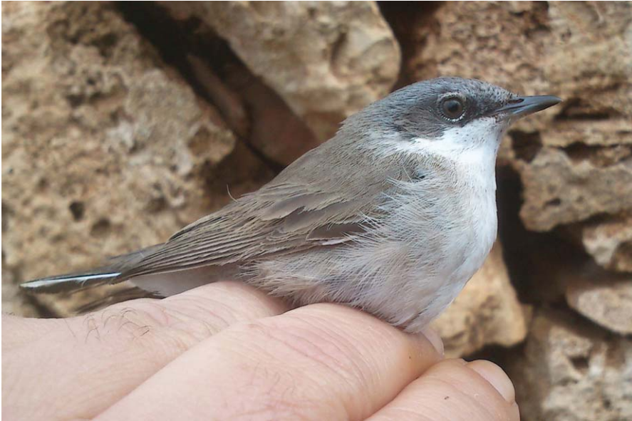
Foto 18. Busqueret xerraire Sylvia curruca (Lesser Whitethroat), illa de l'Aire, maig de 2014.

(Paleàrtic: Mediterrani). Pel que fa a la fenologia a les Balears d'aquest migrant, dates extremes: pas prenupcial amb 39 registres (17/IV, 21/V, 1/VI), primer el 4 d'abril i darrer el 3 de juny; pas postnupcial, només tres cites, el 5, 22 i 25 de setembre.