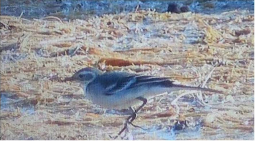
Foto 15. Titina citrí Motacilla citreola (Citrine Wagtail). Primer hivern, prat d'Alcúdia, Mallorca, 20 d'agost de 2016.

(Est d'Europa i Àsia). El CR-SEO considera provada la presència regular de l'espècie i deixa de ser considerada raresa (a Espanya) a partir de l'1 de gener de 2016 (COPETE, et al. 2015). És la primera vegada que es cita al prat d'Alcúdia. Fenologia d'aquest migrant a Balears: pas prenupcial, amb dos cites, es presenta del 3 al 18 d'abril; pas postnupcial, amb quatre registres, del 6 al 28 d'agost i del 18 al 23 de novembre.