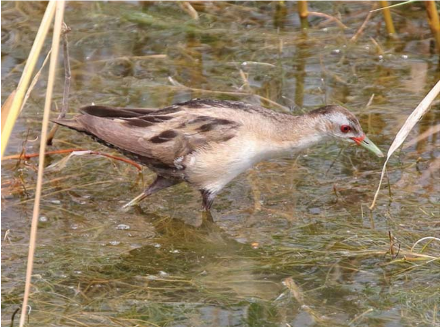
Foto 8. Rasclató Porzana parva (Little Crane), Parc Natural de l'Albufera des Grau, Menorca, 18 de juny de 2016.

maig, que no mostren indicis de captivitat, són susceptibles de ser considerades en la categoria A al territori peninsular i balear. La cita de Menorca, a començament de gener, encaixaria dins d'aquest patró, perquè es tracta d'un juvenil en migració o hivernada a només 350 km de Sardenya, una localitat on l'espècie es presenta de forma regular a l'hivern. La gran superfície d'aigua que les separa no és motiu de sospita ja que, mitjançant la telemetria, s'han detectat individus en migració d'Europa a Àfrica que travessen directament la Mediterrània (GIL-VELASCO, et al. 2017). Primera cita a Balears.