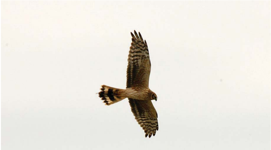
Foto 4. Arpella pàl·lida russa Circus macrourus (Pallid Harrier), Parc Natural de s'Albufera de Mallorca, 2 d'abril de 2016.

ció per a l'àguila pomerània i l'àguila cridanera Aquila clanga per tal de tractar de manera consistent la problemàtica associada a la freqüent hibridació d'ambdues espècies en els països de l'est d'Europa. Fins ara, moltes cites quedaven sense assignació específica davant la impossibilitat de descartar exemplars híbrids, en particular quan el material fotogràfic aportat no era de qualitat (GIL-VELASCO, et al. 2017). Dels registres homologats fins ara, dos corresponen a Menorca i un altre a Mallorca. Dates extremes d'aquest migrant, amb tres registres del pas postnupcial (1/IX, 2/X), primer el 10 de setembre, i darrer el 25 d'octubre.