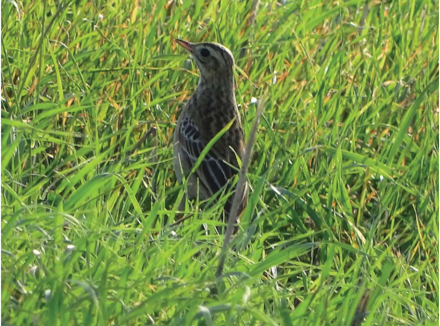
Foto 14. Titeta grossa Anthus richardi (Richard's Pipit), voltants de Sant Climent, Menorca, 14 de novembre de 2016.