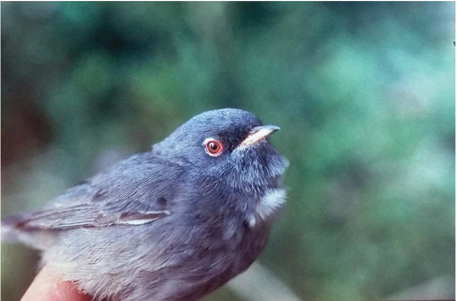
Foto 20. Busqueret sard Sylvia sarda (Marmora's Warbler), mascle, illa de l'Aire, 15 d'abril de 1997. Autor: Óscar García-Febrero.