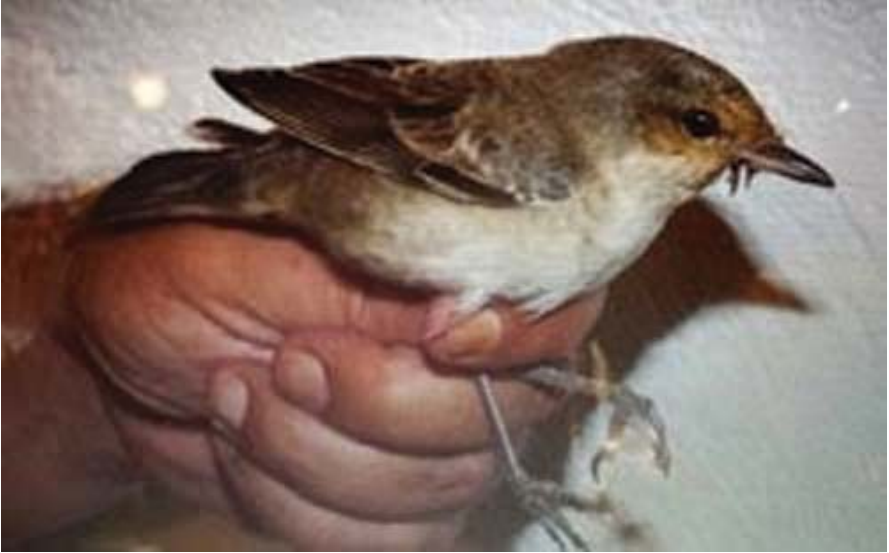
Foto 17: Busqueret falcó-torter Sylvia nisoria (Barred Warbler), juvenil, Parc Nacional de Cabrera, 5 d'octubre de 2014.