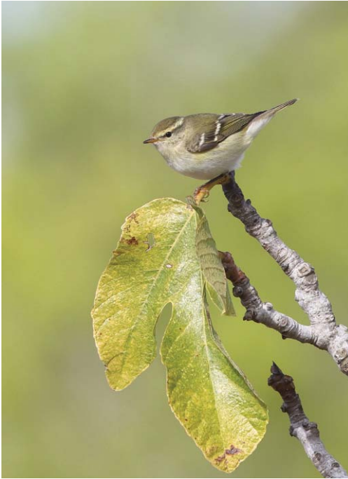
Foto 22. Ull de bou de dues retxes Phylloscopus inornatus (Yellow-browed Warbler), Parc Nacional de Cabrera, 20 d'octubre de 2016. Autor: Juan Sagardía.

2017) tot i que el CRB la segueix considerant rarsa a les Balears. Aquest ha estat un bon any per a Cabrera, amb l'observació en un dia de 6 exemplars. Dates extremes a Balears, totes les cites són del pas postnupcial, de l'1 d'octubre fins al 12 de novembre, i només un registre hivernal, el 8 de desembre.