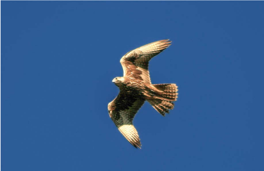
Foto 7. Falcó sagrat Falco cherrug (Saker), juvenil, basses de Lloriac, es Mercadal, Menorca, 5 de gener de 2013. Autor: Esteve Gallardo.

cions situades més a l'oest d'Europa, indiquen que només els juvenils fan migracions, i que un terç d'ells migren i hivernen fora de la zona natal (Kovács et al. , 2014). Fan una dispersió els mesos de juny o juliol de fins a diversos centenars de quilòmetres sense un patró geogràfic predominant, i alguns exemplars poden arribar —els que abandonen el niu aviat— a recórrer més de 1.000 km de distància. Posteriorment, entre el començament de setembre i els primers dies de desembre, ja fan migracions de mitjana distància en direcció S-SO des d'on es troben després de la dispersió, per arribar finalment a les zones d'hivernada. Les localitats d'hivernada, per tant, depenen molt del lloc de dispersió, però una