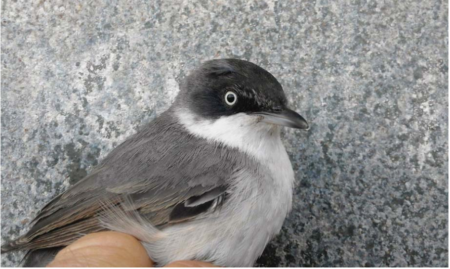
Foto 19. Busqueret emmasquerat Sylvia hortensis (Orphean Warbler), mascle, illa de l'Aire, 24 d'abril de 2016.