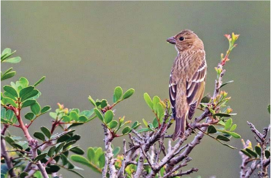
Foto 28. Pinsà carminat Carpodacus erythrinus (Scarlet Rosefinch), Parc Nacional de Cabrera, 12 d'octubre de 2014.