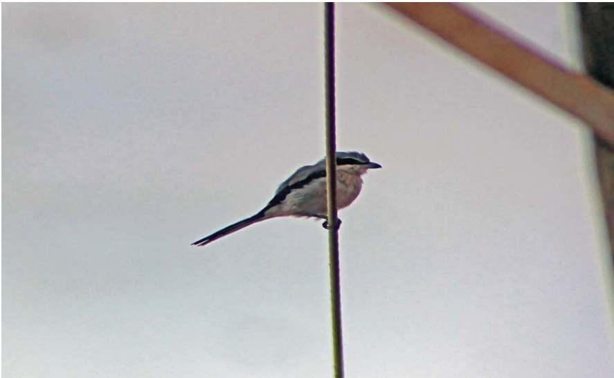
Foto 27. Capsigrany reial ibèric Lanius meridionalis (Southern Grey Shrike), sa Barrala, Campos, Mallorca, el 24 de setembre de 2016.