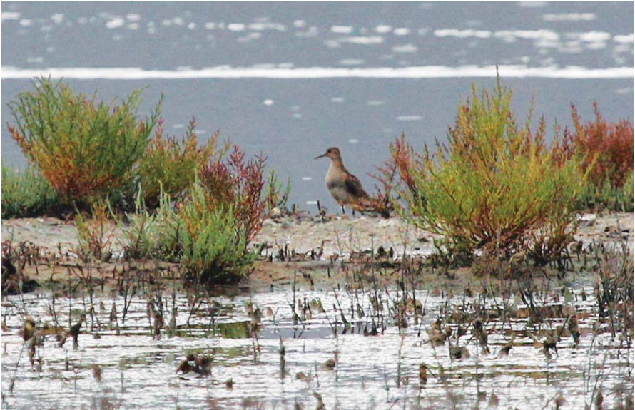
Foto 10. Corriol pectoral Calidris melanotos (Pectoral Sandpiper), juvenil, Parc Natural de s'Albufera de Mallorca, 20 de setembre de 2016.