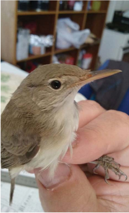
Foto 16: Bosqueta pàl·lida Iduna opaca (Western Olivaceous Warbler), adult, illa de l'Aire, 16 d'abril de 2016.