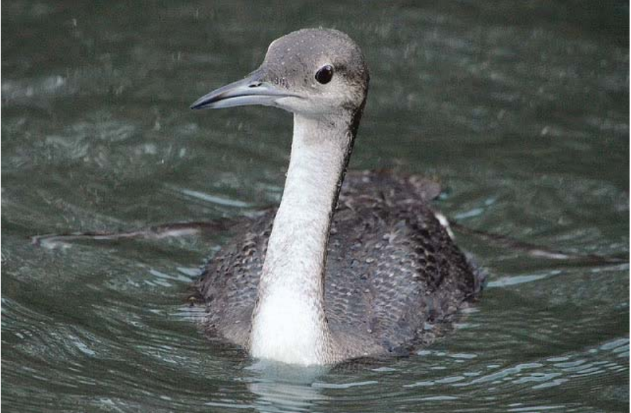
Foto 1. Cabussó Gavia arctica (Black-throated Diver), jove, port d'Andratx, Mallorca, 8 de desembre de 2016.

Savina, Formentera, el 7 de gener de 1985.