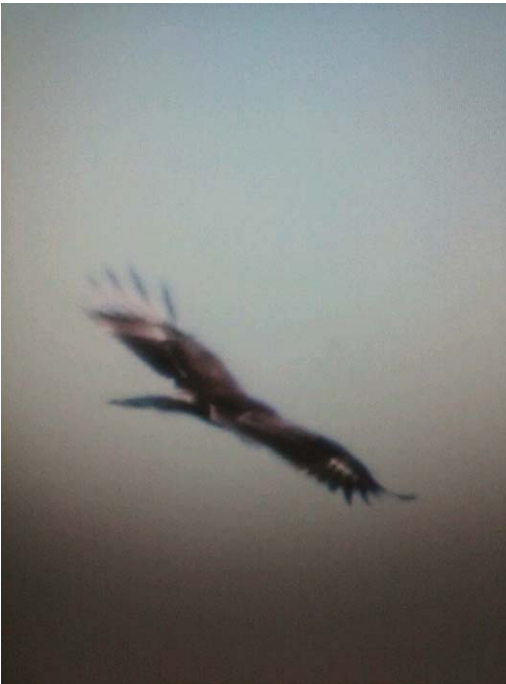
Fotos 5 i 6. Àguila pomerània Aquila pomarina (Lesser Spotted Eagle), juvenil, cap de ses Salines, Santanyí, 17 d'octubre de 2014.