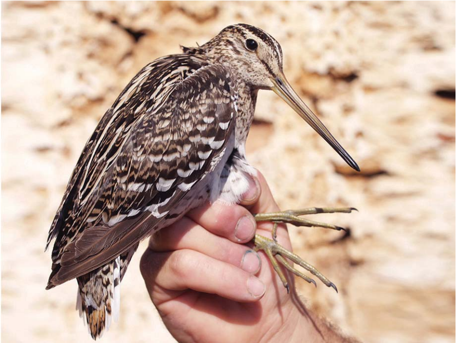
Foto 11. Cegall reial Gallinago media (Great Snipe). Illa de l'Aire, 9 de maig de 2014.

(Nord d'Àfrica i sud-oest d'Àsia) (GIL-VELASCO, et al. 2017). És la primera cita homologada a les Balears, però no és la primera per a Menorca, on hi ha un registre històric d'una captura en data desconeguda, però abans de 1911, que va figurar a la col·lecció de l'Ateneu de Maó (FERRER et al. , 1986). A la península Ibèria les cites es distribueixen equitativament entre la primavera i la tardor. També s'ha de dir que pot ésser observat acompanyant el fuell de collar Charadrius morinellus .