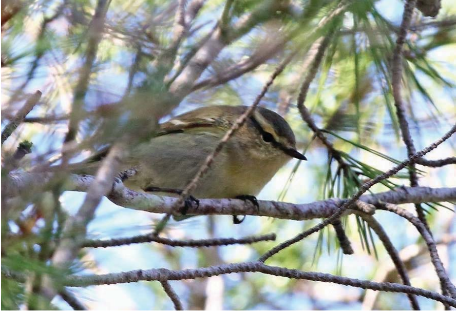
Foto 23. Ull de bou de Hume Phylloscopus humei (Hume's Leaf Warbler), Parc Nacional de Cabrera, 26 d'abril de 2014.

hivernada es registra més escassa- ment (SLACK, 2009). Això fa sospitar que els pocs exemplars d'a- questa espècie que arriben a la nostra regió podrien quedar-se a hivernar al sud d'Europa o nord d'Àfrica, al contrari del que succe- eix amb l'ull de bou de dues ret- xes, la hivernada regular del qual s'ha constatat més al sud, a les illes Canàries i a l'Àfrica occidental (GIL-VELASCO, et al. 2017). Primera cita per a les Balears.