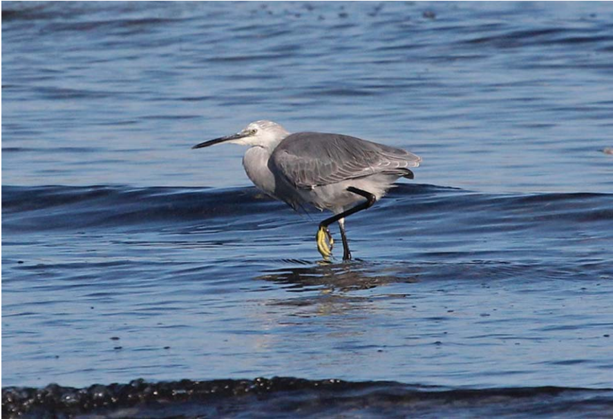
Foto 3. Híbrid d'agró d'escull i agró blanc Egretta gularis x Egretta garzetta (Western Reef Heron x Little Egret), platja de la Reserva Natural de l'Albufereta, Pollença, Mallorca, 1 de desembre de 2016. Autor: Maties Rebassa.

Mallorca: Pla d'Alanzell, Vilafranca, un mascle adult, 30 d'abril de 2013 (Pere Vicens).