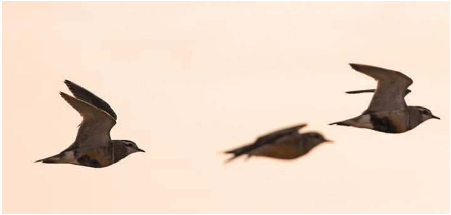
Foto 9. Passa-rius pit-roig Charadrius morinellus (Eurasian Dotterel), Son Salomó, Ciutadella, 18 d'agost de 2016.