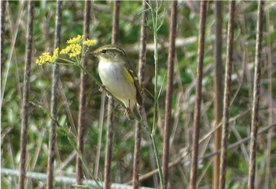
Foto 21. Ull de bou de dues retxes Phylloscopus inornatus (Yellow-browed Warbler), Sant Climent, Menorca, 11 d'octubre de 2016. Autor: Galatea Lligoña.

S'Albufera, a la zona de s'Illot, un exemplar el 17 d'octubre de 2016 (Maties Rebassa).