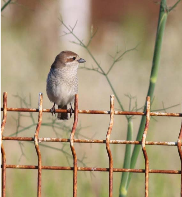
Foto 26. Capsigrany d'esquena roja Lanius collurio (Red-backed Shrike), femella, al nord del port de Pollença, Mallorca, 4 de maig de 2016.