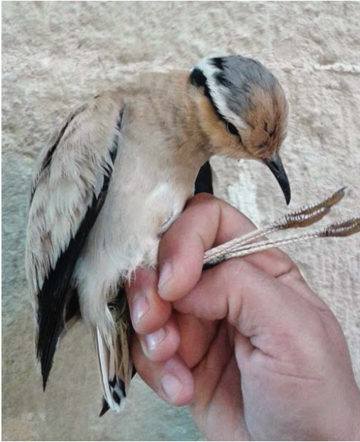
Foto 12. Corredor Cursorius cursor (Cream-coloured Courser), adult, Cós Nou (port de Maó), Menorca, 4 d'abril de 2014. Autor: Menorca Walking Birds.