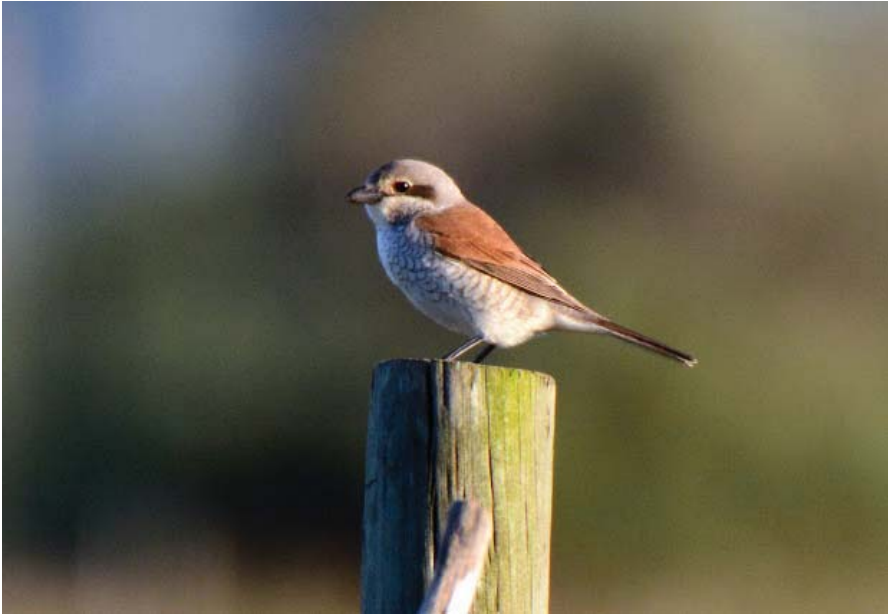
Foto 25. Capsigrany d'esquena roja Lanius collurio (Red-backed Shrike), mascle, Can Cullerassa, Reserva Natural l'Albufereta, Pollença, Mallorca, 3 de maig de 2016. Autor: Josep Manchado.

di), hi ha fotografies, el 15 de maig de 2016 (Santi Catchot, Emili Garriga, Joan Florit).