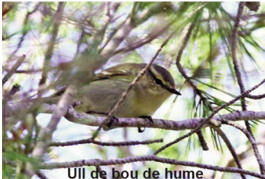
Ull de bou de hume