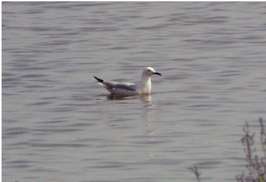
Gavina de bec prim Larus genei (Slender-billed Gull), estany Pudent (Formentera), maig de 2013.