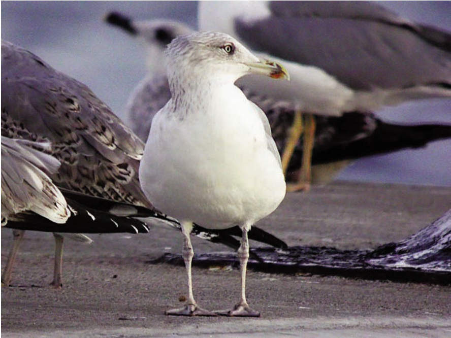
Foto 3. Gavina atlàntica Larus argentatus (Herring Gull), exemplar possiblement de quart hivern. Port de Palma, novembre de 2011.

ode hivernal, de desembre a març, d'exemplars immadurs, especialment de primer hivern, en les costes del nord-est i nord peninsular i illes Balears, amb una cita de l'interior, a Ciudad Real (DIES, et al. 2011). Primera cita homologada i tàxon nou per a Balears.