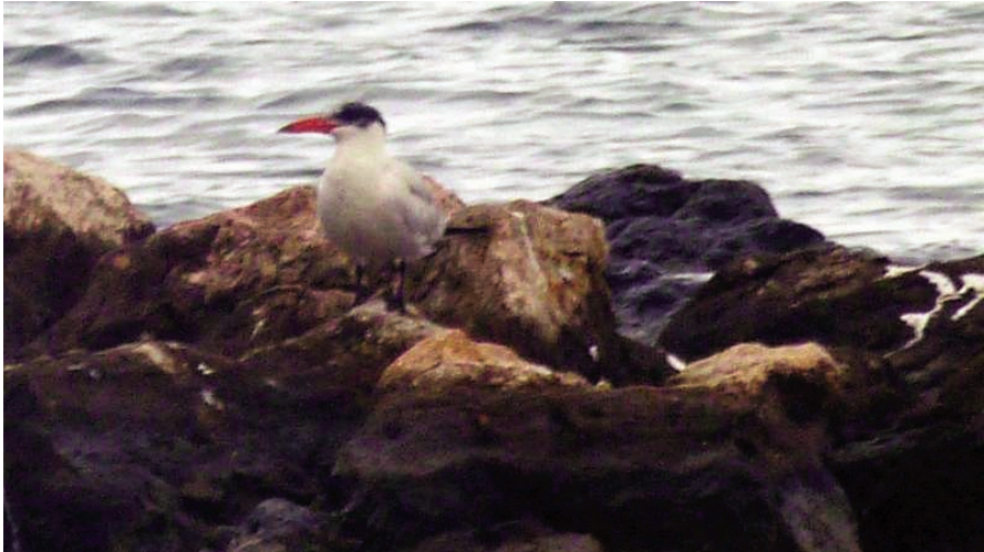
Foto 4. Llambríja becvermell Hydroprogne caspia (Caspian Tern), adult. Port de Pollença, octubre de 2011.

anterior, molt apropiades per l'arribada natural de l'espècie (DIES, et al. 2011).