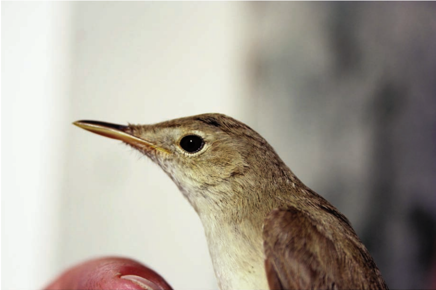
Foto 5. Bosqueta pàl·lida Hippolais opaca (Isabelline Warbler), adult. Illa de l'Aire, maig de 2011.

(Paleàrtic occidental). Encara que se coneixen altres observacions de 2011 i d'anys anteriors que no han estat notificades, se sospita que pot estar criant a s'Albufera de Mallorca. Amb les dades homologades la fenologia d'aquest estival a s'Albufera de Mallorca i migrant a l'Albufera des Grau i l'illa de l'Aire, és: en pas prenupcial, de l'1 d'abril fins al 24 de maig; i en pas postnupcial, tan sols tres registres del 7 de juliol al 2 d'octubre.