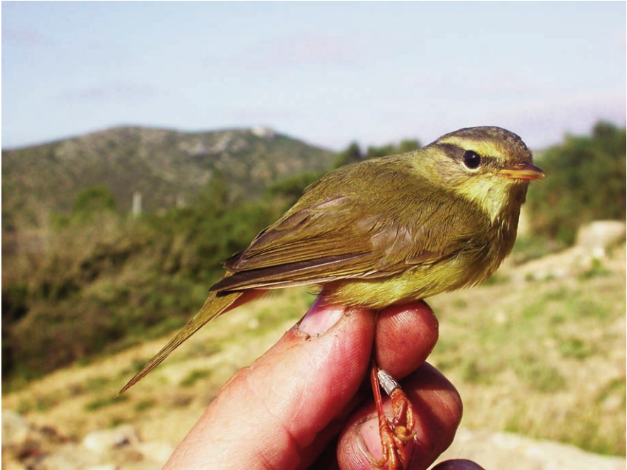
Foto 6. Ull de bou de Schwarz Phylloscopus schwarzi (Radde's Warbler), exemplar de primer any. Cabrera, octubre de 2009.

capturat per a anellament (anella N912158) (A. D. López Alonso).