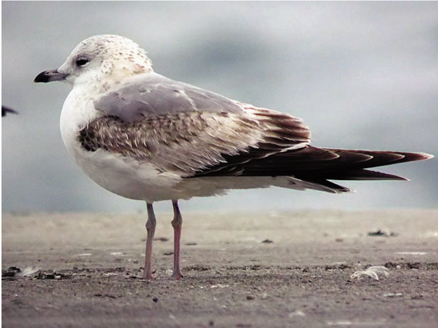
Foto 2. Gavina cendrosa Larus canus (Common Gull), exemplar de primer hivern. Port de Palma, març de 2011.