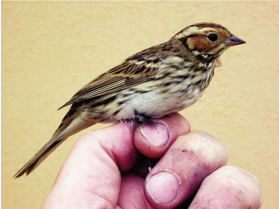
Foto 8. Hortolà petit Emberiza pusilla (Little Bunting), immadur de primer hivern. Cabrera, octubre 2009. Foto: Eduard Amengual.

Cabrera : un exemplar possiblement femella adulta el 13 d'abril de 2011, hi ha fotos (J. L. Martínez).