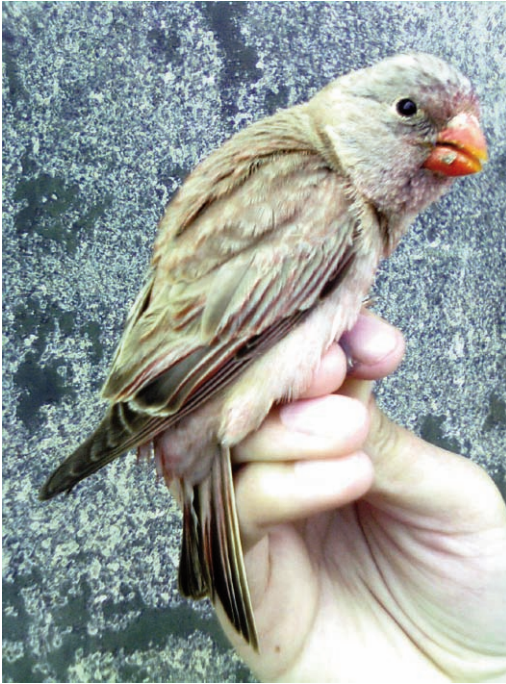
Foto 7. Pinsà trompeter Bucanetes githagineus (Trumpeter Finch), femella adulta. Illa de l'Aire, maig de 2011.

17 d'octubre de 2009, hi ha foto, capturat per a anellament (anella KC0173) (E. Amengual i O. Llama).