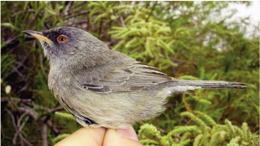
Foto 3a. i 3b. Mascle de segon any de busqueret sard Sylvia [sarda] sarda . 8 d'abril de 2005. Anella CM2428. S'observen les terciàries i les dues secundàries més internes mudades a l'estiu/tardor. Illa de l'Aire.

Photo 3a. & 3b. Second year male Marmora's Warbler Sylvia [sarda] sarda, 8 April 2005. Ring N° CM2428. Note moulted tertials and inner 2 secondaries. Aire Island.