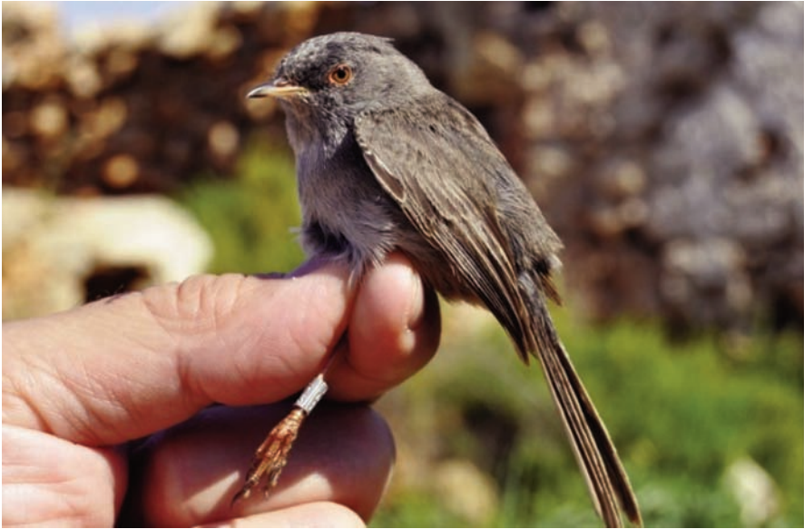
Foto 2. Mascle de segon any de busqueret sard Sylvia [sarda] sarda . 17 d'abril de 2011. Anella KY1563. Illa de l'Aire.

Photo 2. Second year male Marmora's Warbler Sylvia [sarda] sarda , 17 April 2011. Ring No. KY1563. Aire Island.