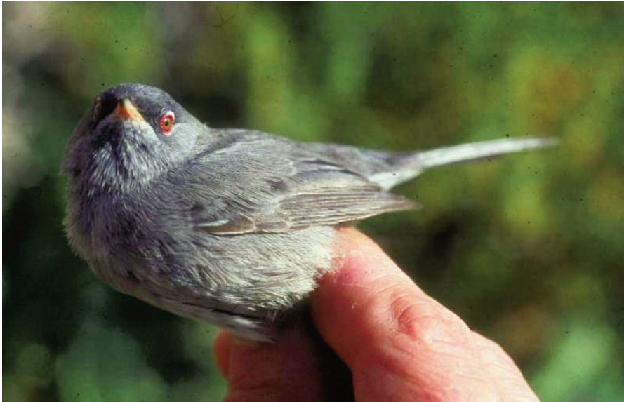
Foto 1. Mascle de segon any de busqueret sard Sylvia [sarda] sarda . 15 d'abril de 1997. Anella 0836367. Es pot observar límit de muda entre les terciàries postjuvenils (grisenques) i les primàries i secundàries juvenils (brunenques). Illa de l'Aire. Photo 1. Second year male Marmora's Warbler Sylvia [sarda] sarda, 15 April 1997. Ring No. 0836367. Note the moult contrast between the grey post-juvenile tertiaries and the brown retained juvenile primaries and secondaries. Aire Island.

En grandària i estructura (Figura 1), el busqueret coallarg s'assembla molt al busqueret roig Sylvia undata , mentre que el busqueret sard s'acosta més al busqueret de capnegre Sylvia melanocephala , encara que lleugerament més petita i cuallarga (Foto 1). Els mascles adults del busqueret sard són en gran part inconfusibles amb la gola, pit i els flancs més grisencs que el busqueret balear, el qual presenta una gola més pàl·lida, gris-blanquinosa amb el pit gris pàl·lid i flancs color salmó. Els mascles de primer hivern i les femelles de busqueret sard recorden al busqueret de capnegre (Foto 3a), amb les parts inferiors més fosques, mentre que el busque-