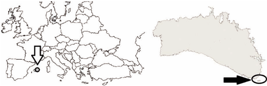
Figura 2. Localització de l'illa de l'Aire, Menorca (Illes Balears, Espanya). Figure 2. Location of Aire Island, Menorca (Balearic Islands, Spain).