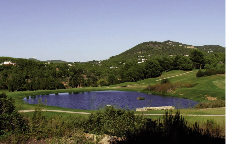
Foto 1. Bassa del golf de Roca Llisa (Santa Eulària des Riu, Eivissa), on el setmesó Tachybaptus ruficollis , ha criat el 2007. Photo 1. Roca Llisa golf course pond (Santa Eulària des Riu, Eivissa), where the little grebe Tachybaptus ruficollis bred in 2007.