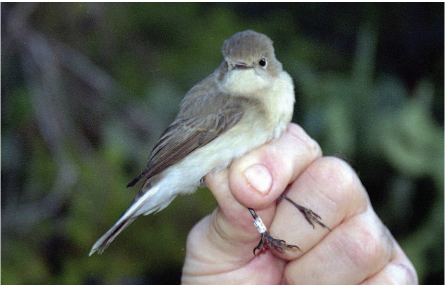
Foto 10. Menjamosques barba-roja Ficedula parva (Red-breasted Flycatcher). Sa Dragonera (Andratx), novembre 2003.