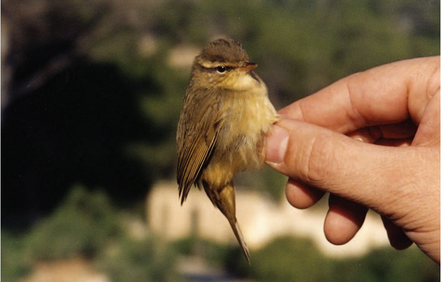
Foto 9. Ull de bou de Schwarz Phylloscopus schwarzi (Radde's Warbler). Sa Dragonera (Andratx), novembre 2003.