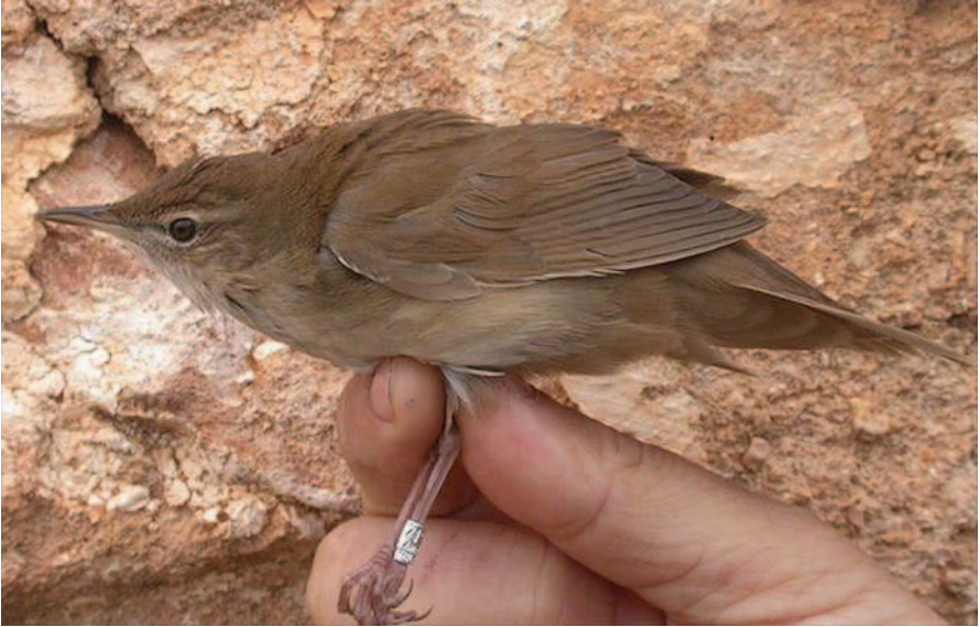
Foto 5. Boscaler Locustella luscinioides (Savi's Warbler). Illa de l'Aire (Sant Lluís), abril 2005.