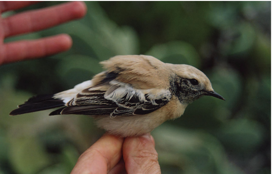
Foto 4. Coablanca del desert Oenanthe deserti (Desert Wheatear). Formentera, mascle de primer any, desembre 2003.