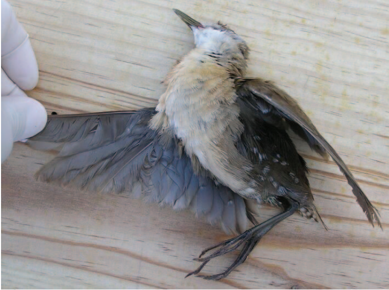
Foto 1. Rasclató Porzana parva (Little Crane). Cales Morts (es Mercadal), exemplar mort, maig 2005.