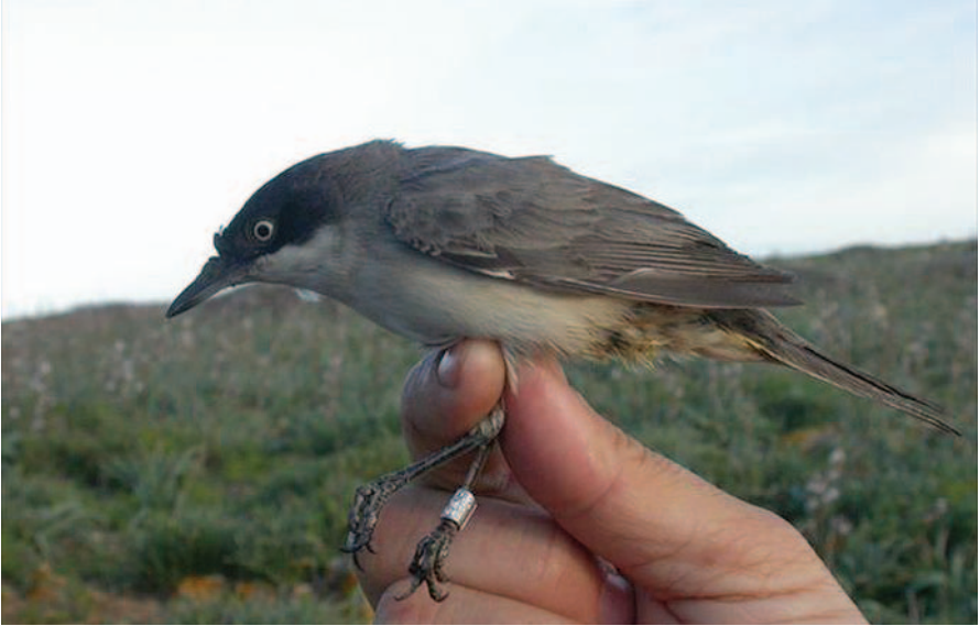
Foto 7. Busqueret emmascarat Sylvia hortensis (Orphean Warbler). Illa de l'Aire (Sant Lluís), abril 2005.