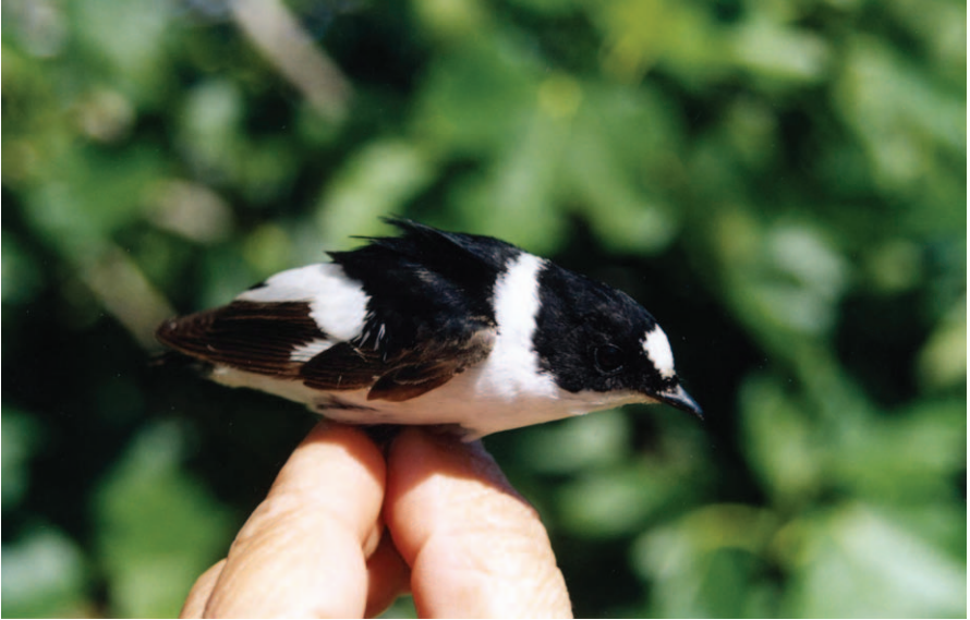
Foto 11. Menjamosques de collar Ficedula albicollis (Collared Flycatcher). La Mola (Formentera), mascle adult, maig 2003.