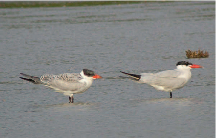
Foto 2. Llambrítja becvermell Sterna caspia (Caspian Tern). L'Albufereta (Pollença), un adult i un juvenil, setembre 2005.