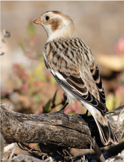
Fotot 12. Hortolà blanc Plectrophenax nivalis (Snow Bunting). Platja de la badia de Pollença, novembre 2005.