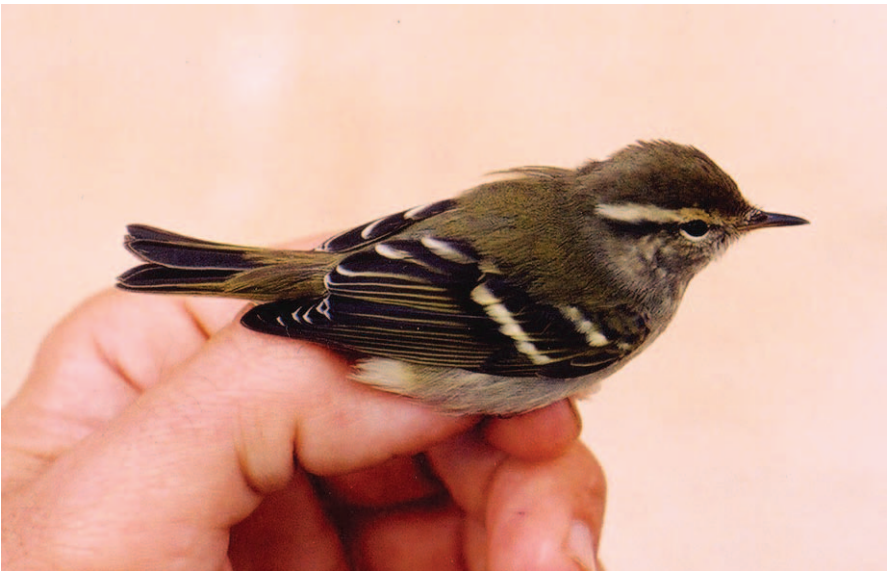
Foto 8. Ull de bou de dues retxes Phylloscopus inornatus (Yellow-browed Warbler). Sa Dragonera (Andratx), octubre 2003. Foto: Juan Miguel González.