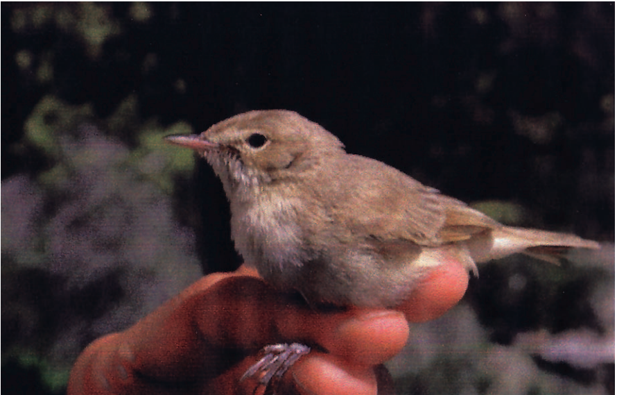
Foto 6. Bosqueta asiàtica Hippolais caligata (Booted Warbler). Sa Dragonera (Andratx), setembre 1998.