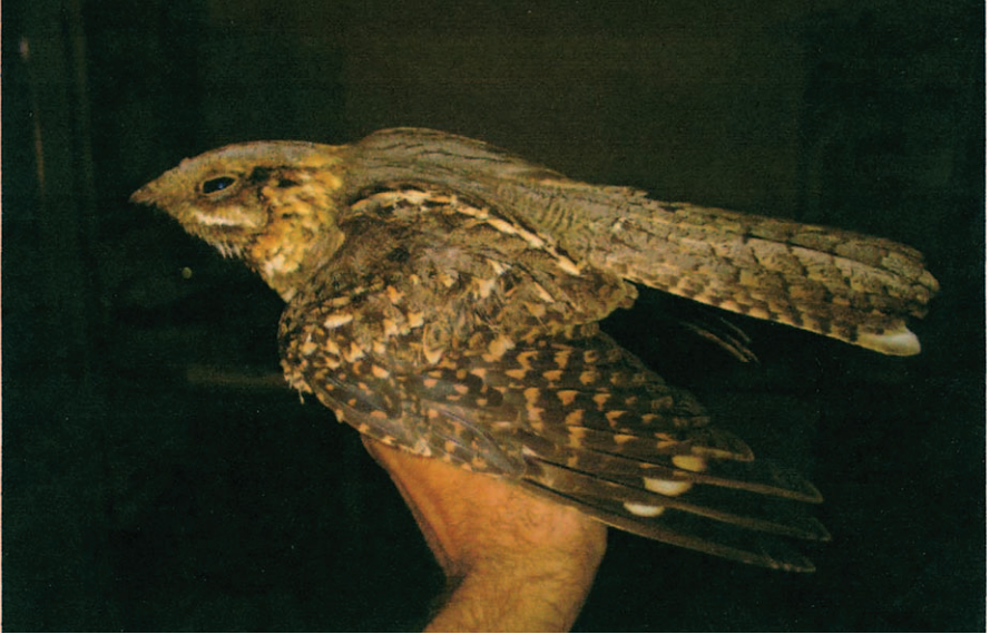
Foto 3. Siboc Caprimulgus ruficollis (Red-necked Nightjar). Can Marroig (Formentera), femella de segon any, maig 2005.