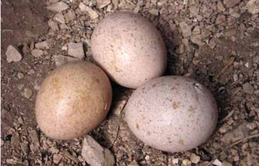
Foto 1. Posta de falcó marí Falco eleonora amb un a l'inici de l'eclosió. Juny 2004.

Photo 1. Nest of Eleonora's Falcon Falco eleonora with one egg starting to hatch.