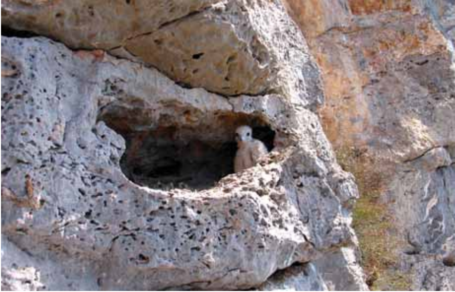
Foto 2. Niu a cova amb un poll de falcó marí Falco eleonorae . Agost 2004.

Photo. 2. Nest of an Eleonora's Falcon Falco eleonorae in a cave with one chick.