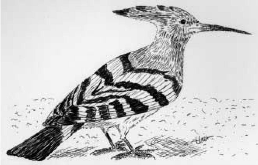
Figura1. Posició de descans del puput Upupa epops . Dibuix: Gemma Carrasco. Figure 1: Hoopoe Upupa epops in a rest position.