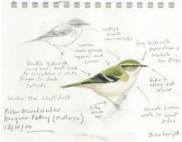
Dibuix 1. Ull de bou de dues retxes Phylloscopus inornatus (Yellow-browed Warbler). Vall de Bóquer (Pollença, Mallorca), octubre 2000. Dibuix: John Wright.