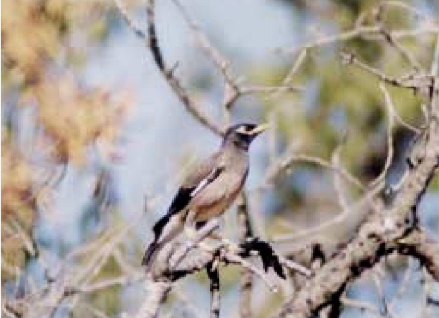
Foto 2. Minà comú Acridotheres tristis (Common Myna). Consell, agost 2001.

Cabrera: 1 ex. del 17 al 22-I al port (GON, ADR, BON).