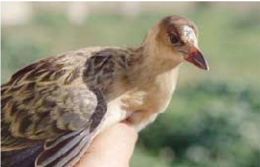
Foto 2. Gallet faver africà Porphyryula alleni (Allen's Gallinule). Es Pagos, Porreres (Mallorca), gener 2002.