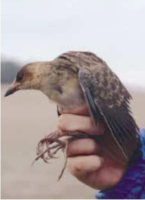
Foto 1. Gallet faver africà Porphyryula alleni (Allen's Gallinule). Es Pagos, Porreres (Mallorca), gener 2002.