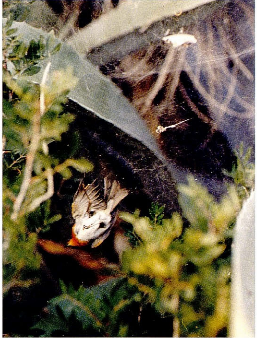
Foto 1. Ropit ( Erithacus rubecula ) atrapat en una teranyina de forma orbicular. La Mola (Formentera), novembre 1995. Robin (Erithacus rubecula) entangled in an orbicular-shaped spider's web.