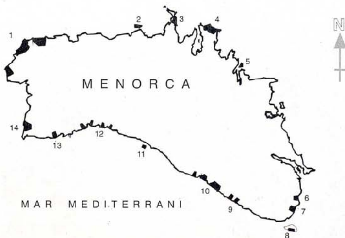
Figura 1. Distribució de les colònies de vinjola ( Apus pallidus ) a la costa menorquina, amb (*) els nous emplaçaments: 1 Costa nord-oest; 2 Illa Bleda; 3 Cap Cavalleria; 4 Mola de Fornells; 5* Illes d'Addaia; 6 Rafalet; 7* Alcaufar; 8* Illa de l'Aire; 9* Binidali-Cova Degollador; 10 Canutells-Cala'n Porter; 11 Escull de Binigaus; 12 Mitjana-Macarella; 13* Son Saura-Cala Vell i 14* Artrutx.

costa de Cala'n Porter, a l'Escull de Binigaus i a la costa nord-oest de Menorca (MUNTANER et al. , 1984). I segons afirma MOLL (1957) és molt abundant com a nidificant a la costa sud de l'illa.