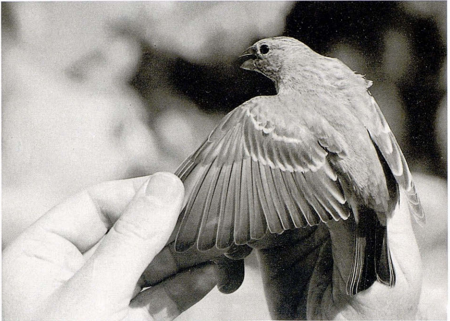
Pinçà carminat (Carpodacus erythrurus) anellat pel GAG a l'illa de Sa Dragonera el 20.09.90.