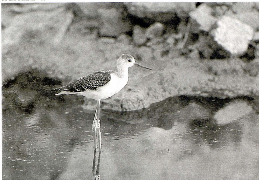
Jove d'avisador (Himantopus himantopus), amb l'anella de color blanca 22M a la pota dreta i a l'esquerra l'anella metàl·lica.

crien avisadors per una comissió de la Ligue pour la Protection des Oiseaux (LPO) francesa que coordina a nivell europeu tota una gran campanya d'anellament amb anelles de color. Els altres països que participen en la campanya empen altres colors com verd per Itàlia, negre per Grècia, vermell per França i blau per Portugal.