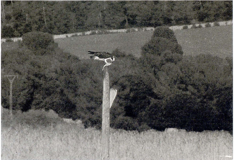
Aquila peixetera ( Pandion haliaetus ) menjant una llissa ( Magel sp) al Cibollar, Parc Natural de S'Albufera.

La identificació de la presa de l'àguila no és senzilla, atesa la distància a què se solen efectuar les observacions. Una avaluació dels seu tamany resulta més