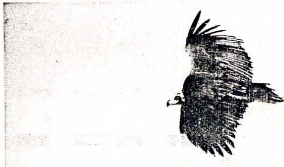
Aegypius monachus Voltor negre

1985 i 1986: Es continua observant, com els darrers anys, un exemplar d'aquesta espècie, establert a la Serra. El dia 7-VIII-86 s'observa a S'Avall (MUN) i el 8-VIII a Santanyi (LIJ). Totes les altres observacions són a la muntanya, entre Soller i Pollença.