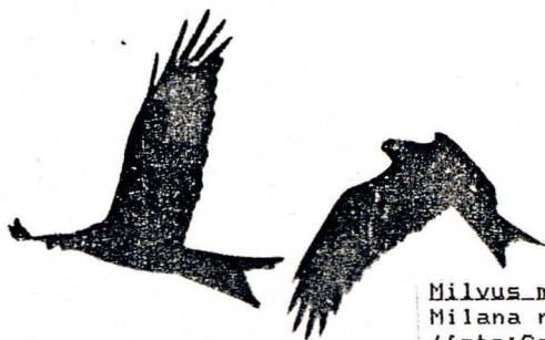
Milvus milvus Milana reial

1985: Relativament abundant (25 ex.) a l'Estany Pudent entre l'11 i el 20-XI (WIJ).