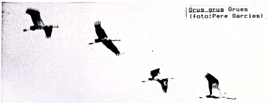
Grus grus Grues

1985: En el mes X hi ha una migració activa: el 27 s'en veuen 6 posades a un conradís, aprop de El Toro (L.Sanchis) i 17 a La Mola de Formentera (COS i WIJ). El 30 n'hi ha 14 a Ses Salines