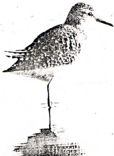
Tringa glareola Valona (foto:Pere Garcies)