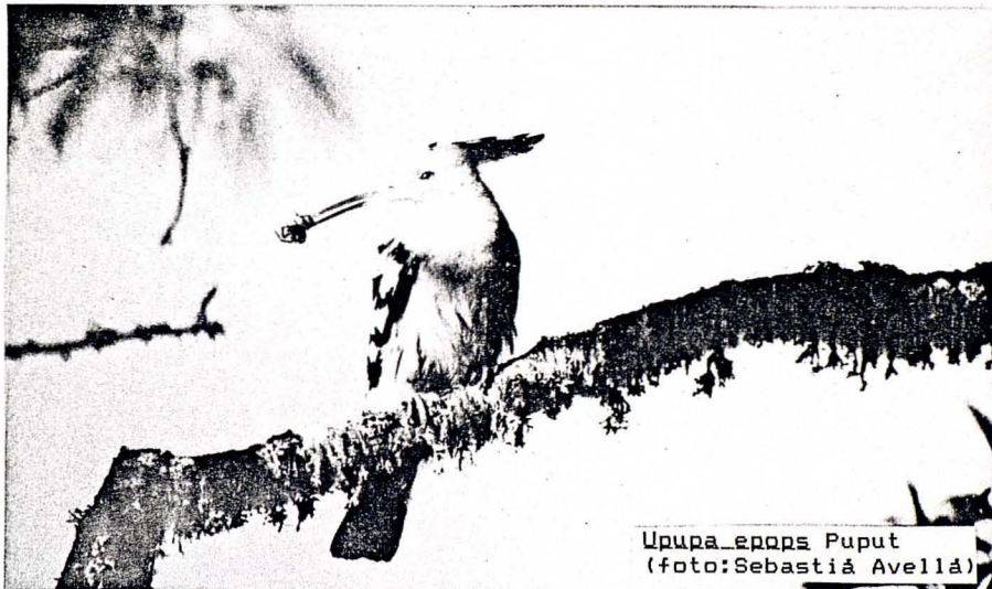
Upupa epops Puput

1985: Algunes dades espectaculars de migració activa: a mig agost, ESC n'observa 25 exemplars concentrats a una figuera de Es Castell; el 3-IX, 16 exemplars volant sobre el poble, i els dies 17 i 20-IX, 50 exemplars a una localitat de Es Castell. (ESC).