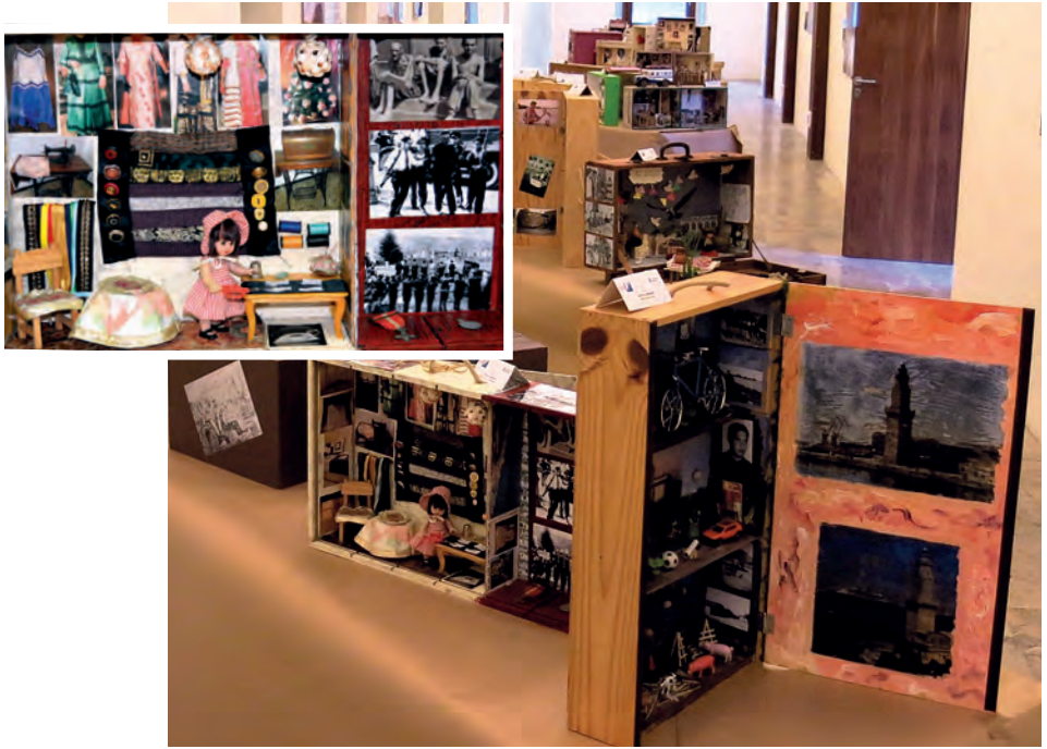
Exposició caixes de vida (Llucmajor, setembre 2017)