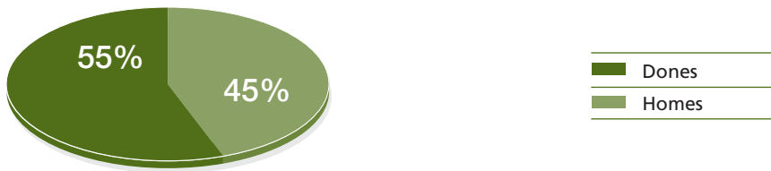
Gràfic 1 | Persones de més de 80 anys

A data d'avui trobam que, segons les dades de Direcció General de Dependència (veure taula de l'annex 2), dels expedients actius a Formentera, 91 expedients (78% dels expedients actius) corresponen a persones dependents, majors de 65 anys i 25 expedients (22% dels expedients actius) corresponen a menors de 65 anys.