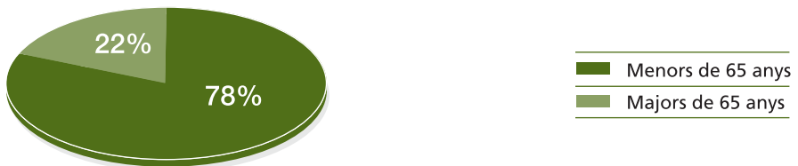
Gràfic 2 | Dependent majors i menors de 65 anys

Analitzats aquests expedients trobam que el 57% de les sol·licituds és donen entre els homes majors de 80 anys, pel que fa a les dones el grup de majors de 80 anys, suposa un 73% de les sol·licituds; seguidament amb un 14% trobam la franja d'edat entre els 65-79 anys, aquesta proporció es igual per als 2 sexes. Per sota dels 65 anys el nombre de sol·licituds davalla considerablement en els dos casos.