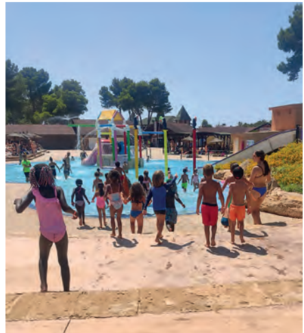
Imatge 5. Els participants d'Obert Estiu Els Tamarells d'excursió a un parc aquàtic