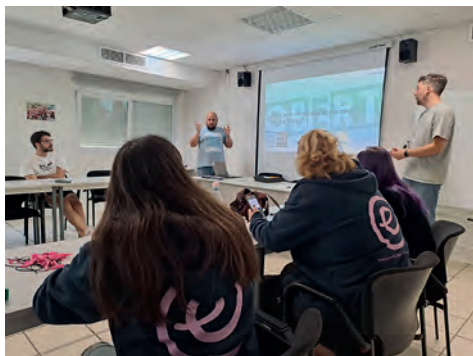
Imatge 2. L'equip tècnic d'Obert fent una reunió transversa

En aquest cas, feim el que hem repetit tantes vegades en aquest procés: compartir els neguits amb la resta de les companyes de camí. I va ser de camí cap a veure'ns amb la direcció del CEIP Coll d'en Rabassa que ho vàrem veure clar: l'escola! Adaptada, amb espais equipats, identificada i coneguda tant pels infants com per les famílies i amb disponibilitat en horari d'horabaixa. I recordam el concepte "trenzar recursos ociosos del territori", que vàrem aprendre de la Fundació Tomillo, que descriu de manera genial el que intuïem: identifiquem en quins horaris estan disponibles els espais de la barriada per poder aprofitar-los al màxim amb altres programes i serveis i, al mateix temps, agafen una mirada comunitària. I l'acollida de la direcció del CEIP Coll d'en Rabassa no podia ser millor: ja ho tenim!