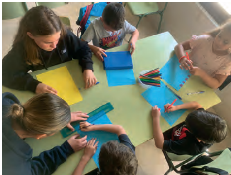
Imatge 1. Alumnat en pràctiques participant a un taller amb infants de l'Espai Obert

Volem defugir activitats dirigides a un únic perfil d'infants sense renunciar a la prevenció de situacions de risc i la intervenció socioeducativa a través del joc. En el mateix sentit, la necessitat de millorar el rendiment acadèmic no entén de perfils (malgrat que sigui més accentuada en uns que en d'altres).