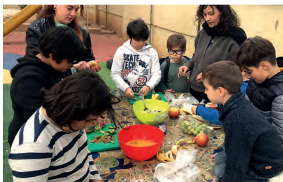
Imatge 6. Els infants de l'Espai Obert Molinar fan un taller de berenar saludable