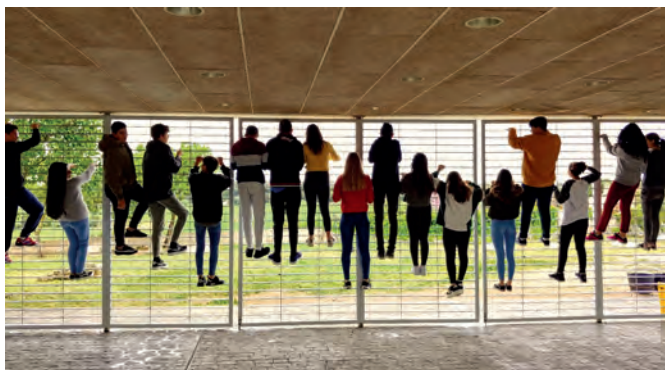
Sessions de cos al centre

en el cas de l'acció, és un poc com una eina de treball, un estri, un objecte que jo puc manipular..."; "surts al món i veus el que veus, que no t'agrada, els drames de l'emigració, el sexisme [...] reaccions perquè no pots no fer-ho, perquè el que veus no t'agrada [...] Tinc ganes de cridar i com que ets artista, aquest crit surt en forma d'obra".