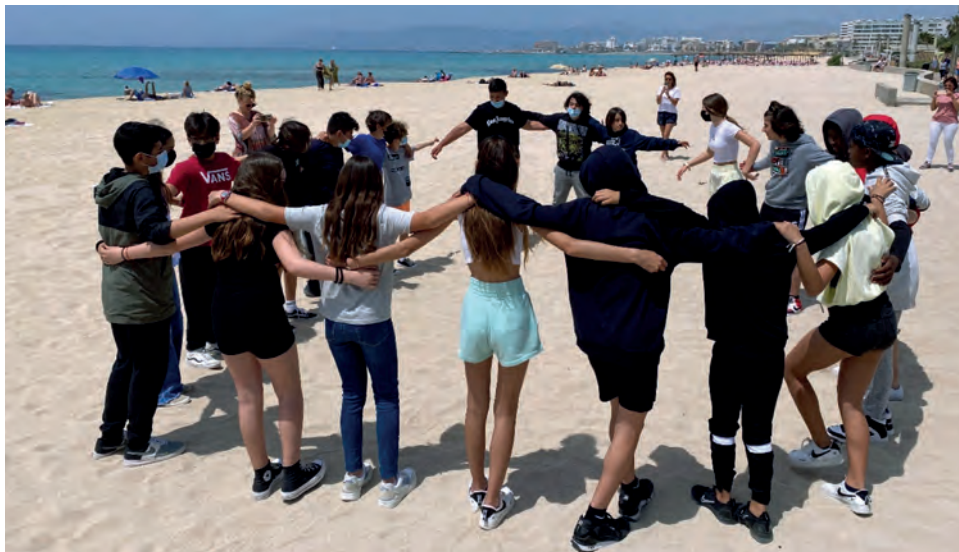
Performance final a l'espai públic

El contingut de les performances realitzades s'ha centrat en algun dels aspectes de les temàtiques de gènere abordades al llarg del procés de treball. Cada grup s'ha decantat per transmetre un missatge concret segons els seus interessos i inquietuds, i així trobam que s'han abordat qüestions com els rols, els estereotips, els prejudicis o la violència masclista, entre d'altres.