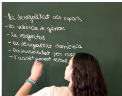
Treball de gènere a l'aula

Es fa una proposta d'aplicació a l'aula des de cada centre que treballa conjuntament un mateix projecte en què l'eix conductor és el gènere i l'art; tot des de les diverses matèries del professorat participant.