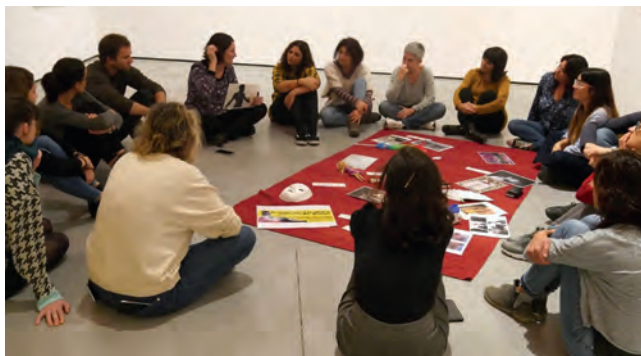
Sessió de formació de professorat: art contemporani i gènere a Es Baluard Museu

La formació s'adreça a professorat de secundària en actiu, de qualsevol àrea o matèria. Es posa èmfasi especial en el fet que els participants d'un mateix centre siguin docents d'àrees diferents i a la vegada que comparteixin un mateix grup d'alumnes. Serà amb aquest grup d'alumnes compartit amb qui es durà a terme la transferència a l'aula de la formació i serà aquest grup qui participarà en les fases del projecte adreçades a l'alumnat i que durà a terme el projecte final de performance.