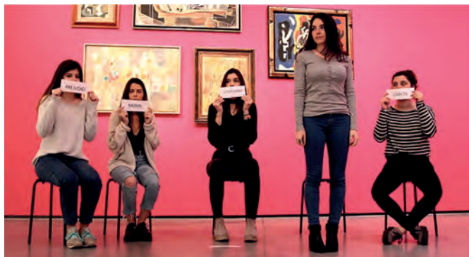
Visita taller de l'alumnat a Es Baluard Museu

Es Baluard Museu d'Art Contemporani de Palma fou inaugurat el 30 de gener de 2004. Està ubicat a l'entorn patrimonial del baluard de Sant Pere, part de les