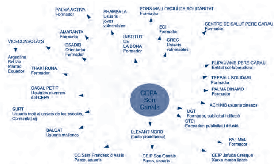
Diagrama de la feina en xarxa

La col·laboració creada entre el CEPA i aquestes institucions i entitats té un triple objectiu: