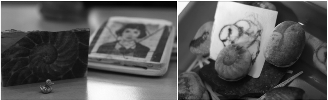
Imatges 3 i 4.