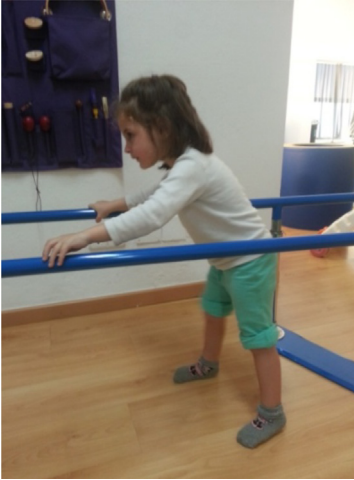
Foto 1. Atenció directa. Sessió a l'aula de fisioteràpia i/o psicomotricitat. Aprenejatge d'estratègies per a la marxa.