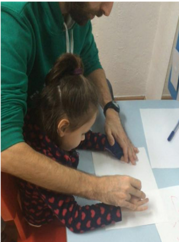
Foto 3. Atenció directa. Sessió a l'aula ordinària. Correcció de la postura en sedestació.