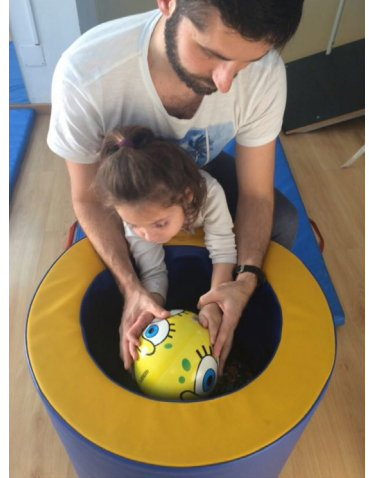
Foto 2. Atenció directa. Sessió a l'aula de fisioteràpia i/o psicomotricitat. Destresa manual.