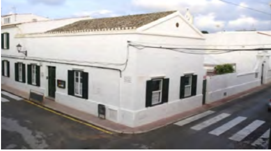
Entre els anys 1904 i 1908 es va construir un nou edifici en el carrer Sant Gabriel, que va ser un referent d'escola activa en aquella època.