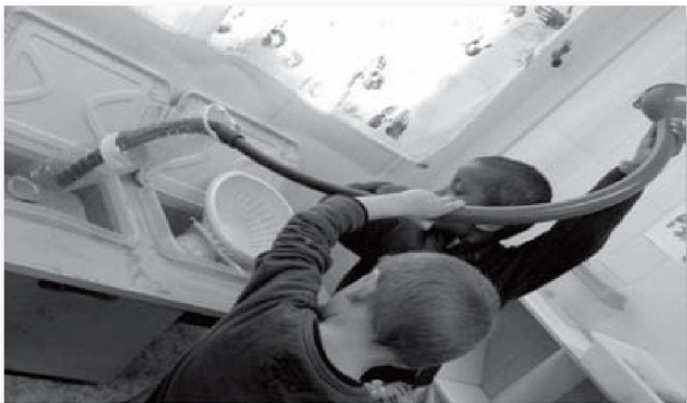
Un infant competent, curiós, actiu, ple de potencialitats