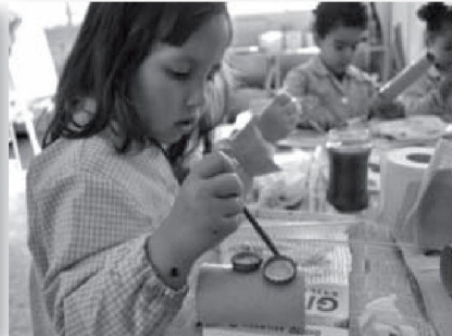
TALLER DE L'ART