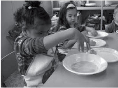
TALLER DE CUINA

matemàtic, musical..., i puguin desenvolupar la creativitat.