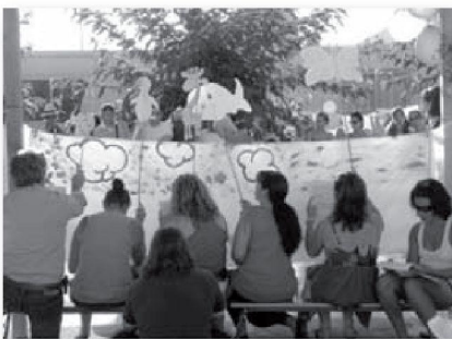
Pares fent una representació teatral en la festa de l'estiu 2010