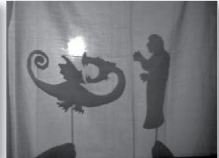
TALLER DE CONTES