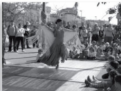
Actuació de ball espanyol d'una mare en la festa de l'estiu 2011