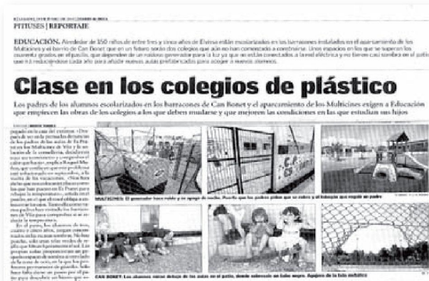
19 de juny de 2010

Posar en marxa un centre de nova construcció en les condicions de l'estructura prefabricada ha estat un repte que hem anat desenvolupant paral·lelament al nostre projecte pedagògic.