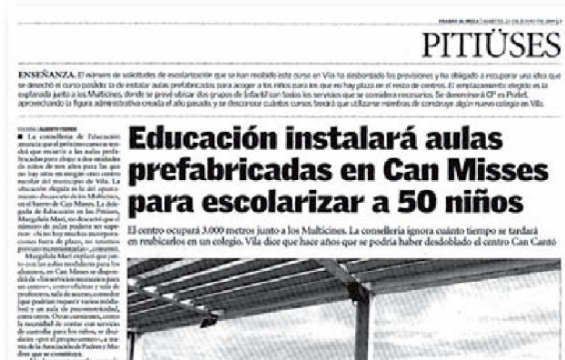
23 de juny de 2009

La feina que va fer l'equip de mestres amb professionalitat i il·lusió féu possible engegar un projecte educatiu de qualitat, encara que periòdicament fos notícia a la premsa.