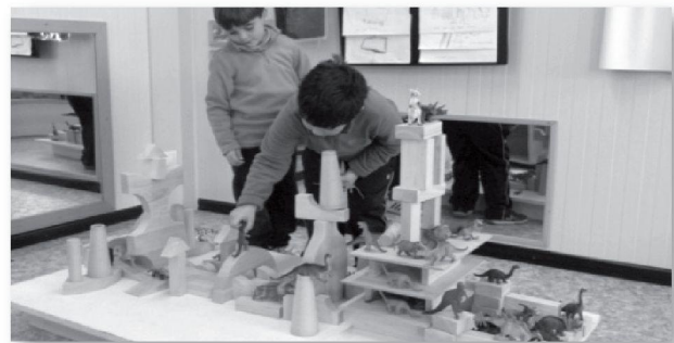
TALLER DE LES CONSTRUCCIONS