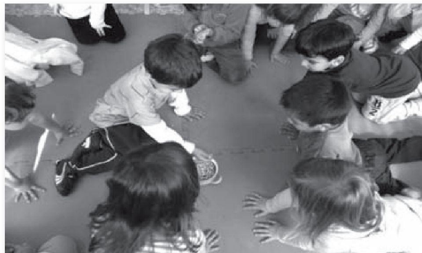
Un infant que és l'eix de tot el procés d'aprenentatge