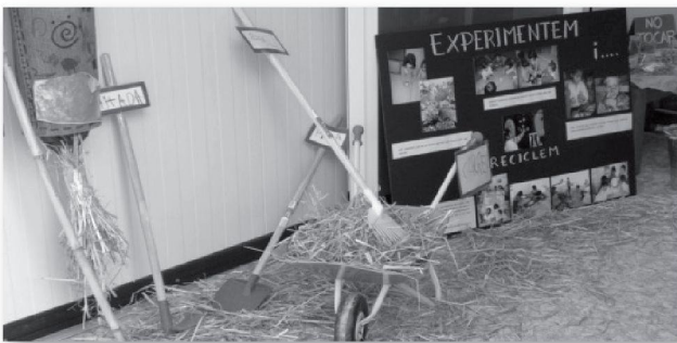
TALLER DE L'HORT