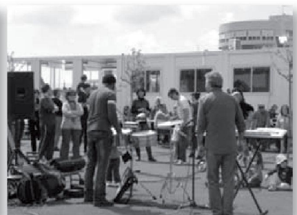
Col·laboració musical d'un pare en la Festa de la Primavera 2009