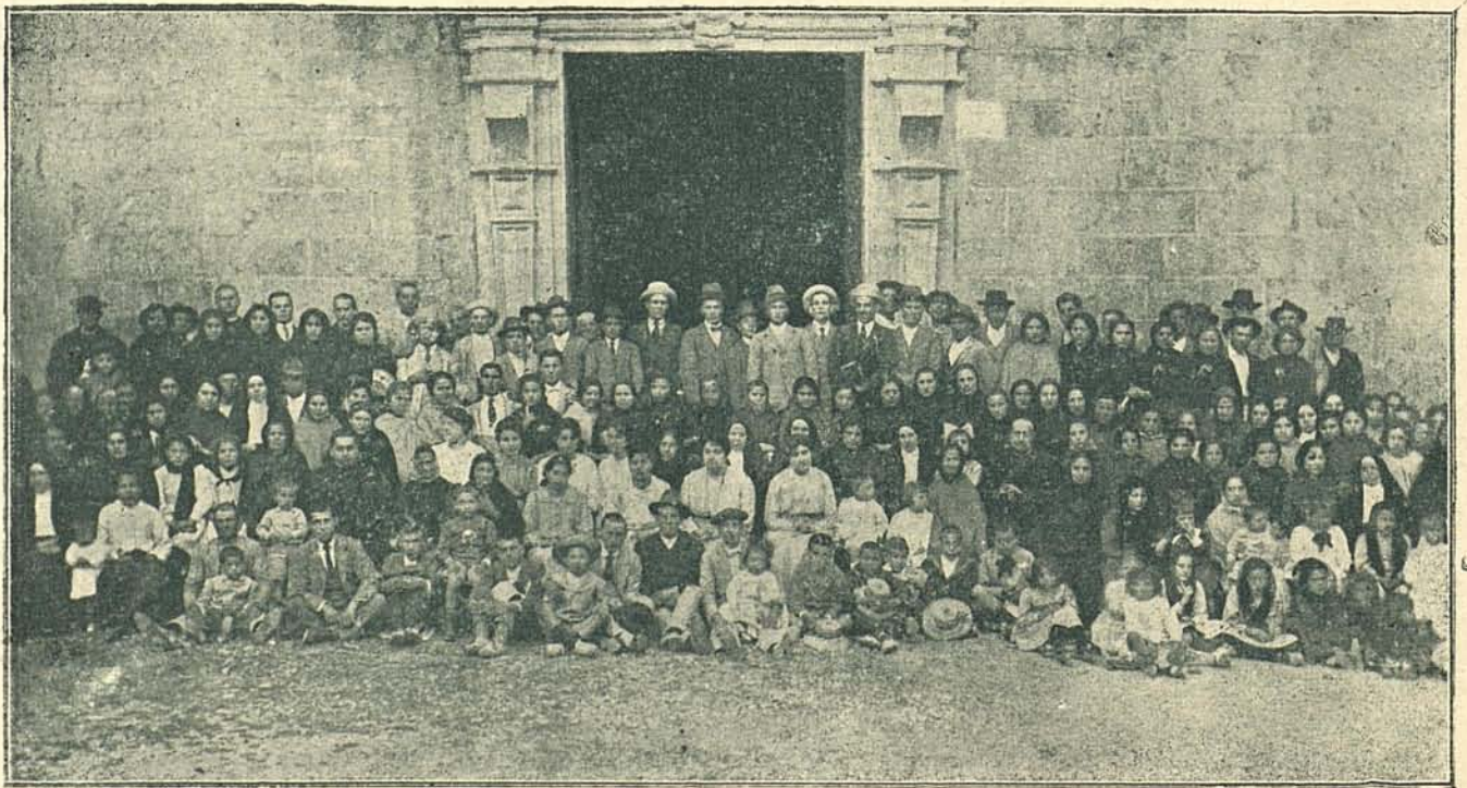
LA PEREGRINACIÓN A LLUCH DEL DÍA 5 DE JUNIO

Dijo «Correo de Mallorca»: « Defla resucitó por unas horas aquellos heroicos tiempos en que la iglesia y el castillo vivían estrechamente unidos, y al adelantarse la comitiva por la feudal estancia parecía un cuadro en acción de los que tan magistralmente supieron trasladar al lienzo nuestros Velázquez, Pradilla y Casado del Alisal, en los que se destacan obispos, abades, monjes, guerreros, damas y caballeros. Las torres almenadas de Defla , como si despertasen de