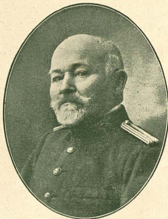
D. PEDRO JAUME ESTEVA

TENIENTE CORONEL DE CARABINEROS QUE FALLECIÓ EN SINEU EL DÍA 23 DE ENERO A LOS 63 AÑOS DE EDAD.