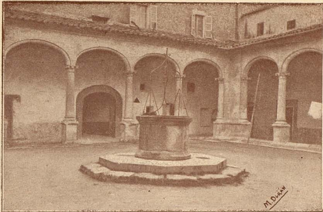
Claustro del Convento de San Francisco