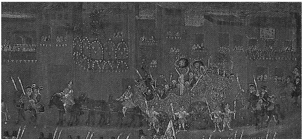
2. Carro triomfal de la festa gremial de la Coronació de Carles III (detall). Ciutat de Mallorca, 1759. Font: Festa i cerimònia a Palma, Rúbrica 11.