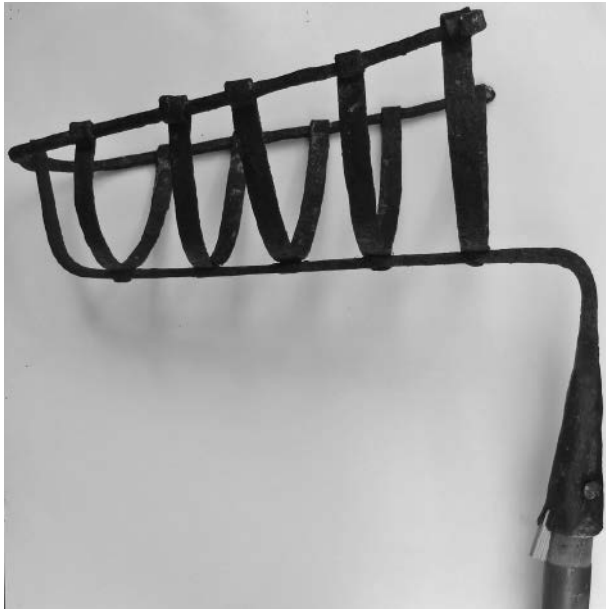
1. Fester, segle XVIII (?). Museu Parroquial. Lluçmajor.

Si bé el carro triomfal no sempre l'hem trobat citat a la darrerria del segle XVIII, el tornam a localitzar l'any 1806, quan es pagaren 9 lliures per muntar-lo i per alçar uns arcs decoratius enmig de plaça. Aquests arcs devien ser a l'estil dels qui tots recordam i que hem vist en fotografies antigues: fileres d'arcs rodons o apuntats fetes amb material fungible (murta, fusta, branques de mates, pins o fassers, alguns llaços o teles de colors alçades pel vent, etc.). 16