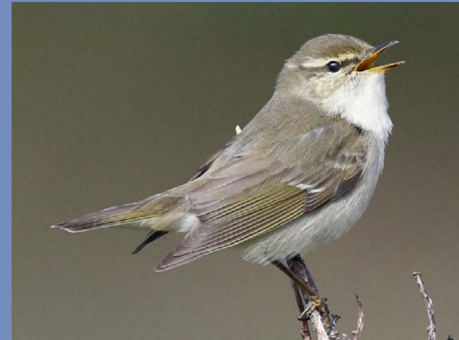
Ull de bou boreal, Phylloscopus borealis .

A Espanya només s'havia citat una única vegada al 2008, quan un exemplar fou observat prop de Jerez de la Frontera, Cadis. Curiosament, el 16 d'octubre del mateix any es va confirmar la tercera cita per a l'Estat amb l'anellatge d'un exemplar a Doñana, Huelva. Contràriament, a Gran Bretanya és una de les rareses septentrionals més comunes, amb una mitjana de 6 cites anuals, amb quasi totes les observacions entre l'agost i l'octubre, i amb dos terços al setembre. •