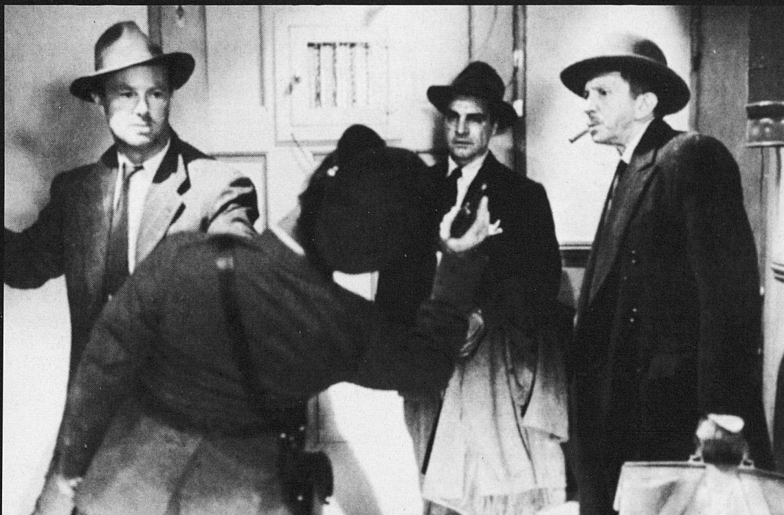
La jungla de asfalto

Volia comentar que les escales tenen molt interès —i en la història del cinema hi han jugat un paper important—, per dues raons. La primera, perquè l'estructura de l'escala permet trencar la llum i per tant té una fotogènia. Com al Acorazado Potemkin , les escales són fotogèniques. I la segona és que té un simbolisme inherent. El cinema alemany està fet d'escales, amb tot un simbolisme del superior-inferior, autoritat: dominant-dominat, conscient-inconscient, cel-infern. Hi ha un joc de bipolaritat. ■