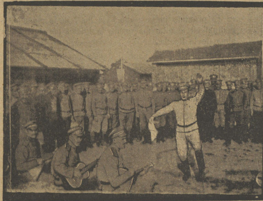
En el campamento de los rusos que fueron á combatir en Francia. La danza nacional.

bien que se casa conmigo; este casamiento es mi garantía de ser buena, y me lo echas en cara como una maldad. ¿Dices que es por cariño? ¡Mentira! No me quieres. Si me quisieras, te alegrarías de mi felicidad.