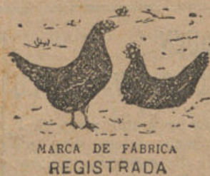
MARCA DE FÁBRICA REGISTRADA