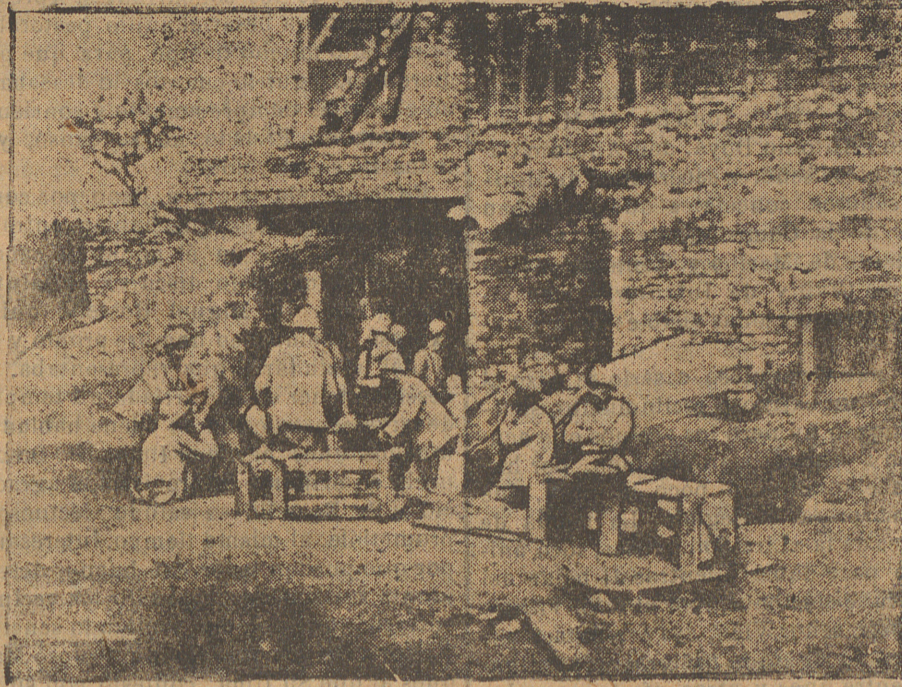
Si los muros tienen oídos...

—Hija mía, ¿estás loca? —Pues sí, madre, mi amor por ese hombre, es puro, inmenso; él me ama con locura, por mi amor está loco y está ciego... Y ¿usted qué me aconseja? —Que desistas, hija, pues para nadie es un misterio que le llevas quince años, y es un pillo, y un holgazán, y un vago, y un desecho, que se te va a comer en cuatro días toda la hacienda que te dejó Pedro, y que así que te vea en la miseria se marchará con otra, ¡tu has de verlo! Mi consejo de madre es este, hija: ¡no te cases jamás con Indalecio! —Pues, muchas gracias, madre; el consejo, de veras, agradezco.