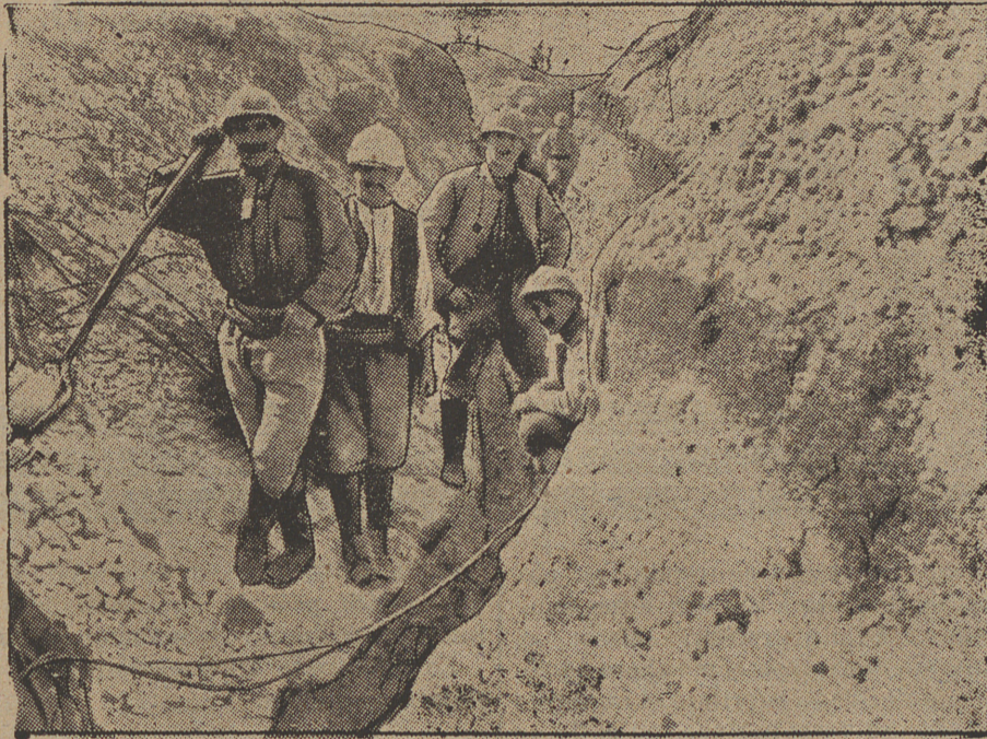
Los servios esperan la partida para la revancha

chando los carrillos como si fuesen pellejos de vino, abriendo la boca hasta casi desquiciarla; porque él era así para reír, sobre todo cuando oía cosas de tanta gracia como la que acababa de soltar Tío Lión :