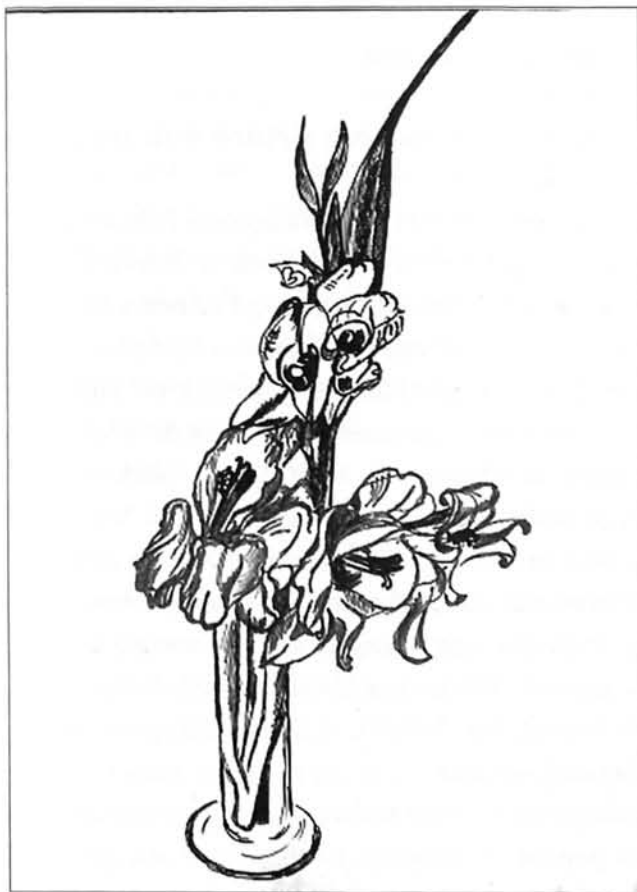
Dibuix de Joan Fullana

Del llibre Recers de boira (estudis sobre la transparència) , publicat a La Nau, 1994.