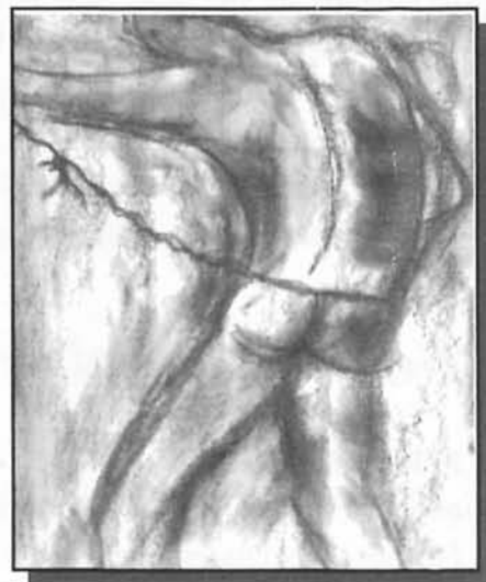
Il·lustració de Rainelda Palerm

I aquest carrer que veig des de la meva persiana emmarcada en blau Quins racons ataronjats deu amagar? Aquell jove bru que camina xiulant tan malenconiós devora el moix blanc Camina cap a una cita d'amants o pensa escolar el temps jugant al backgamon? I el soldat que està a la cantonada sota els geranis amb les galtes enceses Acaba de rebre una flor de la noia que desapareix rera la persiana groga? I el nin que corre cridant paraules tan argentades, tan blanques Serà demà un soldat empegueït, un jove malenconiós o tal vegada Un misteri jaspia de taronges, blaus i perfumat de gessamí? Que em fa de mal el cap! Hauria de deixar d'escriure avui! Aquest mal d'esquena! Alexandria em sembles un somni difús Tants de blaus, verds, blancs, ocres, carmins, daurats Als ulls no em deixen veure com mor la tarda besant el port. Agafaré la pesant clau de ferro d'aquesta habitació I mentre l'aire vermell es taca de negre Correré a refugiar-me a la taverna. Necessito el fum, els joves, El renou dels inclements daus, les bregues i el vi. (La porta es tanca donant peu al seu soroll xuclant De la tinta que ferma les paraules al paper: l'envelliment del meu cos i la meva aparença ferida és de terrible punyal... )