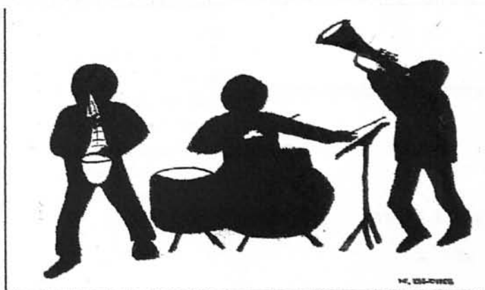
Dibuix de Miquel Blanes

Amb la seva col·laboració, han fet possible aquesta nova edició del Suplement Literari de La Veu