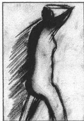
Il·lustració de R. Palerm