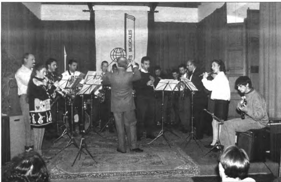
L'"Orquestra" actuà per primera vegada davant un públic que acceptà de molt bon gust l'oferta dels seus setze components.