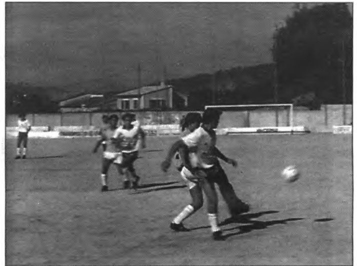
Rodríguez i Montserrat es disputen la pilota.