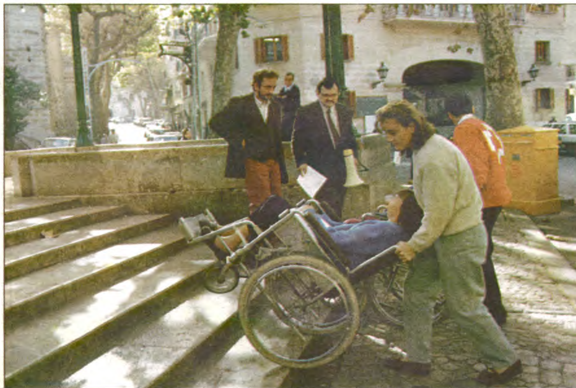
Els minusvàlids demostraren la impossibilitat d'accedir a llocs tan habituals com les Cases de la vila, l'església, la plaça del brollador, el tramvia o els bars i comerços de la zona.

Gual ha criticat també aquesta despesa supèrflua en comparació amb d'altres necessitats: "La batlessa sempre diu que no té partida pressupostària per destinar als esports, per exemple, però quan li ha interessat ha sabut trobar doblers per moblar un despatx".