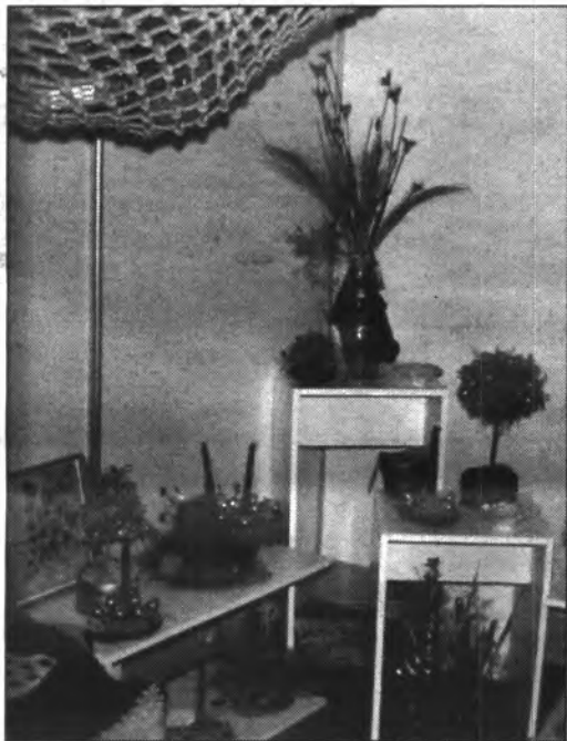
El Taller Ocupacional salleric exposà centres de Nadal de ceràmica i flors seques.