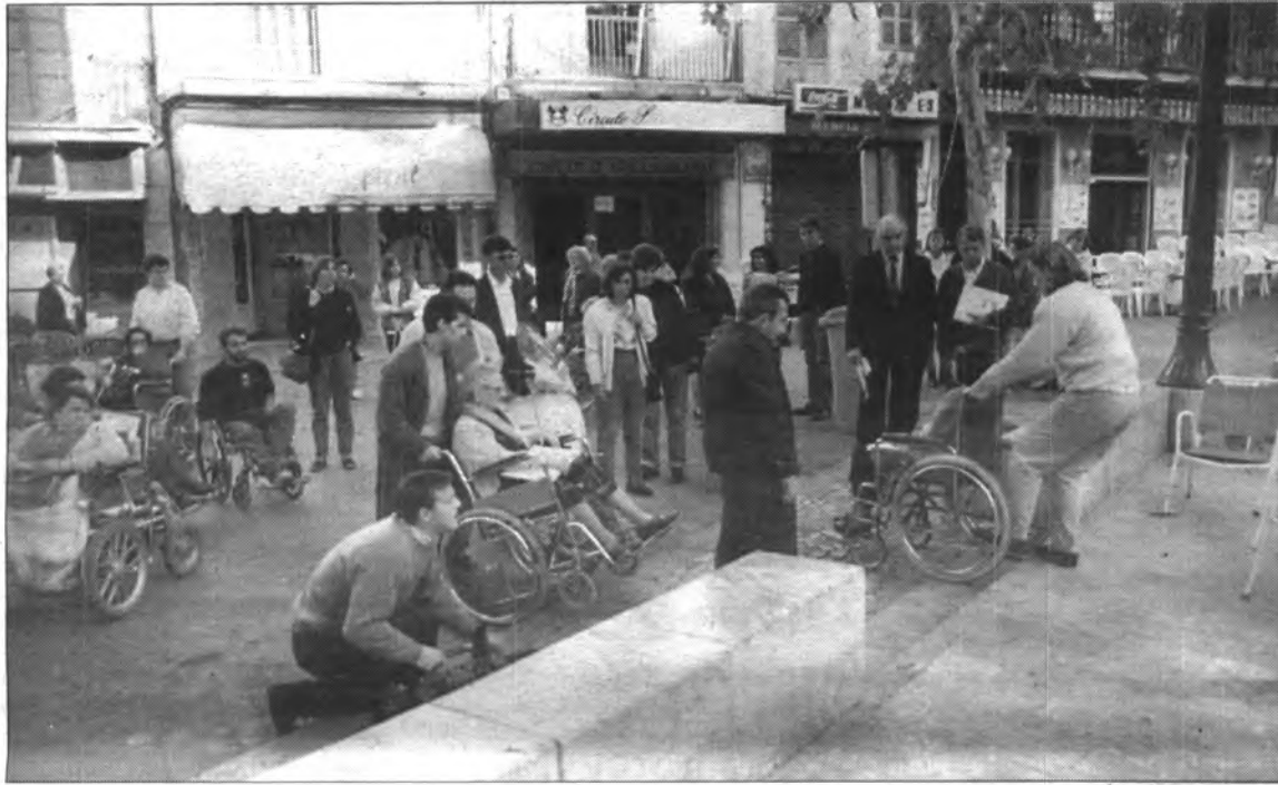
Amb les cadires de rodes, els minusvàlids no poden entrar a la plaça sense ajuda.