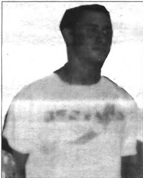
Christian marcà per partida doble.

El gol vingué després de que els jugadors locals ja haguéssin tret tres corners seguits .