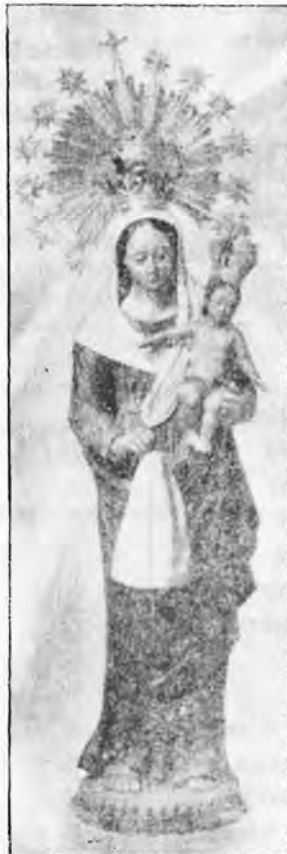
Mare de Déu de La Trapa.

Dedicado al pueblo de S'Arracó y sus gentes