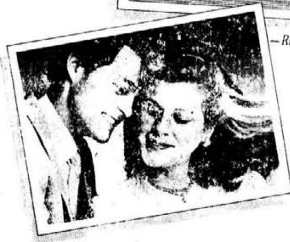
Refleja sentimientos auténticos, inalterables, eternos.