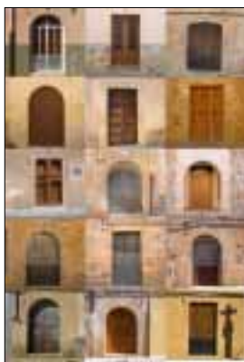
PORTADA 15 portes

Tots hem vist que els que arribaren fa anys, en petites dosis, es varen integrar sense problemes i ara són ben algaidins, però una allau com la que ens pronostiquen no té integració possible, ni lingüística ni cultural ni cívica. Això sense comptar els serveis escolars, sanitaris, de tot tipus, que ens quedaran petits, que s’hauran de multiplicar. Bé, per avui ho deixarem aquí.