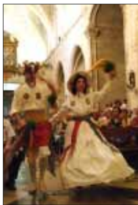
PORTADA L'Oferta

En fi, haurem d'esperar. A l'octubre, amb la fase B, ja començarem a veure els resultats de la reforma i si les sensacions són positives. Convé, però, tenir en compte que l'Ajuntament s'hauria de comprometre seriosament a fer complir les normes de circulació, concretament les d'aparcament. Si no és així i no es fa des d'un principi, no anirem pel bon camí.