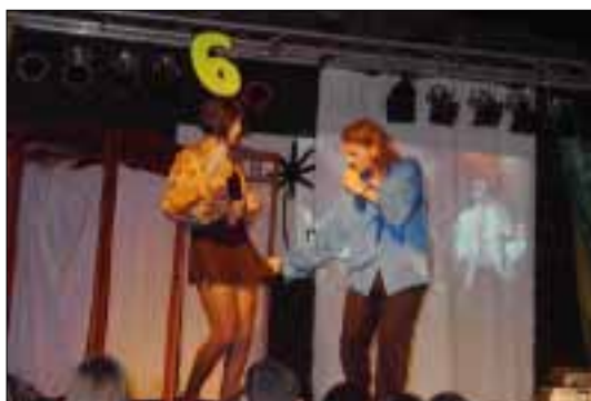
Fotografies de Jerònia Pou