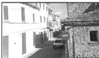
Disc indicador al carrer de l'església

Per acabar, cal afegir que al carrer de Frai Lluís s'hi han pintat les retxes grogues que només permeten una aturada de cinc minuts, o el que és el mateix que a partir d'ara no s'hi podrà estacionar.