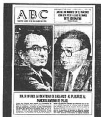
Fotografia del frontís de l'ABC.

Aquesta iniciativa de l'Ajuntament no ha fet més que seguir les múltiples mostres de defensa a les pretensions lingüístiques del Govern, donat que quasi la totalitat dels articulistes habituals de la premsa insular i del Principat han emprat els seus articles per rebutjar les contínues agressions a la llengua, encara que la mesura municipal pugui semblar més reivindicativa donada l'expressió de la moció, que diu que "ha estat norma de l'Abc mentir grollerament a propòsit de la situació lingüística de l'Estat i molt particularment amb les comunitats de parla catalana, tot intentant crear un estat d'opinió contrari al desenvolupament dels nostres drets lingüístics".