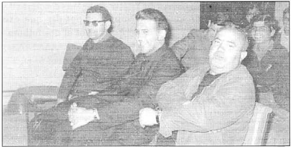
Festa de benvinguda a Santo Domingo l'any 1968

Clar que sí! Una salutació a tots els vilafranquers i vilafranqueres, que sàpiguen que per devers Santo Domingo hi ha un «Bosseta» que hi fa tota la feina possible. I com que venc d'un poble bàsicament pagès, ara que ajut als pagessos dominicans, els puc donar una mà molt més experta i sàvia de la mà del poble de Vilafranca.