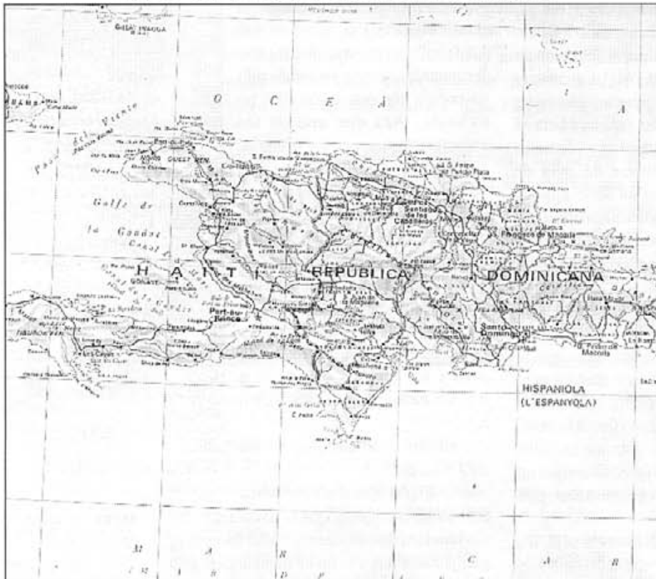
Plànol de la República Dominicana

Constitució. Constituida en una República Presidencialista, des del l'any 1986, és el president en Joaquín Balaguer; però és com si fos considerada una dictadura. La capital és Santo Domingo amb 1.410.000 hab. I per acabar, en el tema cultural; l'educació és gratuïta i obligatòria des dels set als catorze anys. Les universitats són: L'Autònoma de Santo Domingo, la Nacional Pedro Ureña, la Catòlica