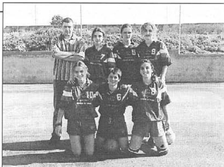
L'equip juvenil ha perdut l'entusiasme dels altres anys.

Vilafranca 3-Manacor 2 Vilafranca 0-Petra 3 Portol 0-Vilafranca 3 Manacor 3-Vilafranca 0 Vilafranca 3-Felanitx 0 Vilafranca 3-Portol 0 St. J.Obrer 3-Vilafranca 0 Muro 3-Vilafranca 0