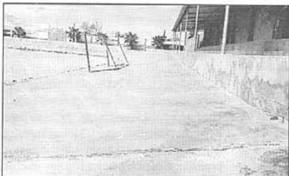
La recta de contra-arribada tampoc és un excepció

altra part la S.D. Vilafranca, com a representant del ciclisme local, hauria d'incentivar l'ús de la pista entre el nostre jovent, i no tant jovent, i multiplicar les curses en aquesta instal·lació tan desitjada per molts dels pobles veïnats.