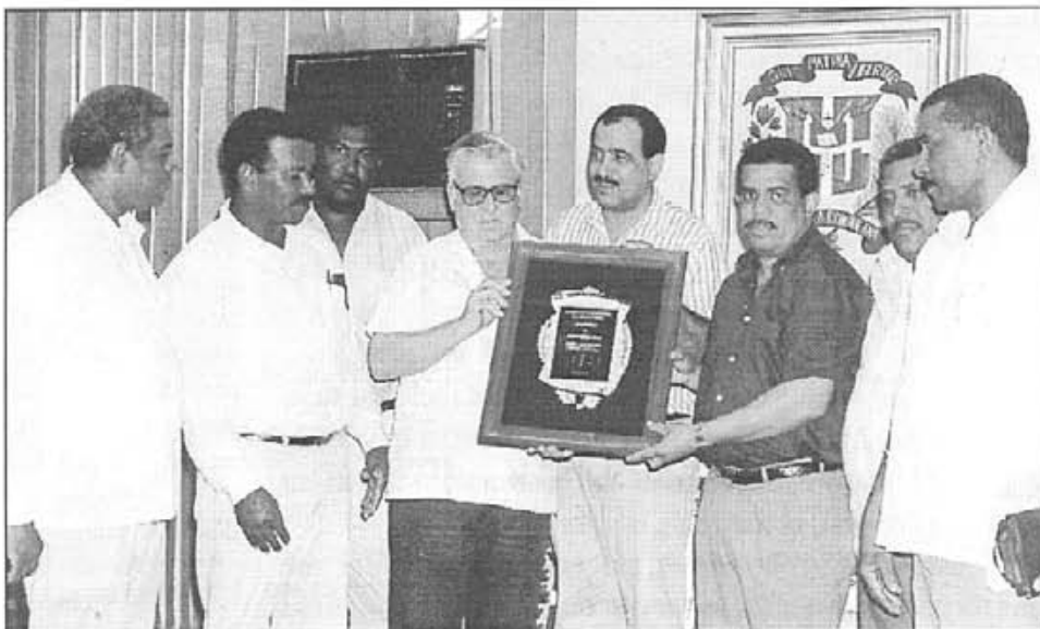
L'any 1995, abans de venir aquest estiu a Mallorca, reb l'homenatge dels dominicans

- A la República Dominicana en fa vint-i-viut i mig que hi som. Hi hi vaig anar no per pròpia iniciativa sinó perquè m'hi varen enviar; perquè jo vaig anar a l'Argentina per fundar un seminari i quan vàrem esser allà la cosa no va anar bé i ja que érem a les Amèriques, em destinaren a la República Dominicana. Va haver una alçada d'un grup de comunistes i de