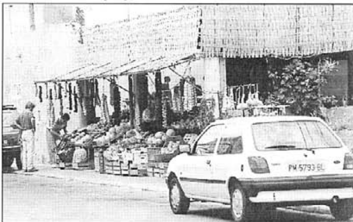
L'Ajuntament pensa que els comerciants i productors són els més beneficiats

El grup de govern del nostre Ajuntament vol que els venedors de fruita s'identifiquin encara més amb l'organització i participació de la Festa del Meló. Durant una reunió mantinguda entre les dues parts, alguns dels comerciants manifestaren que estaven cansats d'esser sempre els mateixos els qui haguessin de suportar tot el pes de la celebració. L'Ajuntament també ha sol·licitat un major patrocini econòmic des del sector que més es beneficia de la festa. Aquesta mesura reflexada a la carta enviada a venedors i productors ha estat durament criticada pel grup de l'oposició. A la mateixa circular el grup de govern demana una col·laboració econòmica per afrontar el dèficit que genera la Fira i Festa del Meló.