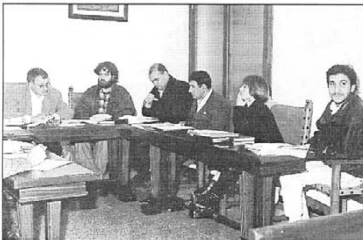
El polític, funcionari o arquitecte que informa, resol o vota una resolució injusta pot estar fins a 3 anys de presó, multa i inhabilitació.

Les infraccions urbanístiques són diferents segons les comunitats autònomes ja que cada comunitat té legislació pròpia en matèria urbanística. Això significa que una mateixa infracció urbanística pot tenir la diferent sanció segons la legislació de cada comunitat.